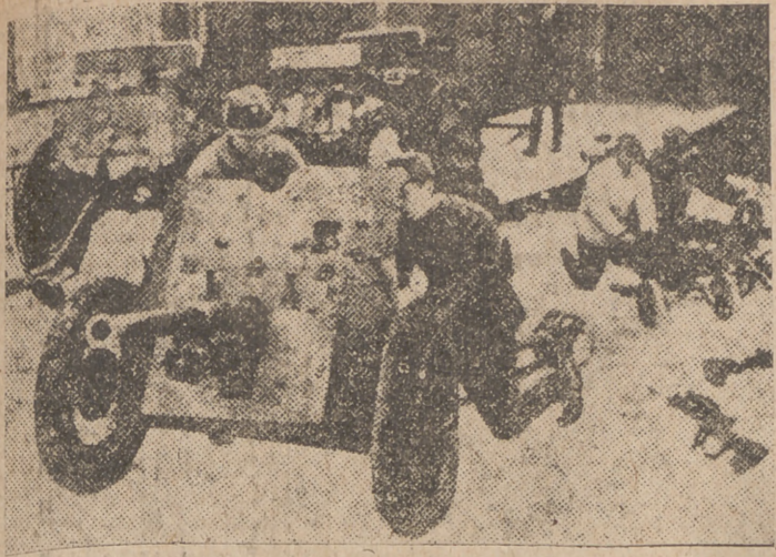
Cañones de campaña capturados por los finlandeses a las tropas soviéticas en el frente de Carelia.