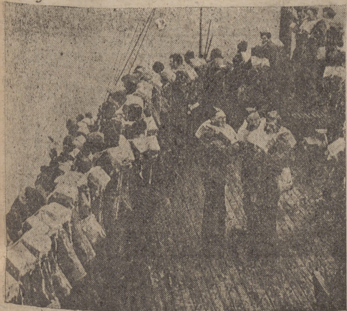
Es expuesto el cruzar el Canal de la Mancha. En previsión de cualquier contratiempo, los soldados ingleses que en convoyes son conducidos a Francia, van provistos de sus equipos de salvamento.

CHAMBERLAIN TRATA DEL ATAQUE AEREO EN LAS COSTAS DE ESCOCIA. (Información en las páginas centrales)