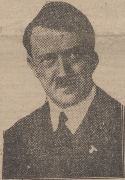
EL FUHRER CANCELLER

BURGOS, 31.—En respuesta a las felicitaciones recibidas con ocasión de las espléndidas victorias del invicto Ejército, que han puesto fin a la guerra, el CAUDILLO ha contestado por medio de los siguientes telegramas: