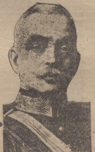
EL GENERAL CARMONA

"A S. E. el general Carmona: Muy reconocido a vuestra felicitación y la de la noble nación portuguesa, por la victoria final de las armas nacionales, victoria en que siempre creyó el pueblo portugués y que permitirá estrechar cada día más, los lazos de amistad entre los dos pueblos. — GENERALISIMO FRANCO."