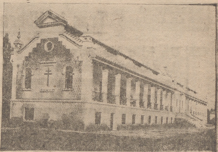
Cerca de Scrilla, sustraidos a la oleada caliente del sol andaluz por la frondosidad del parque, están los pabellones del Sanatorio de El Tomillar, hoy con 75 lechos, que han de ser ampliados a 250, transformando así el Establecimiento en uno de los más ejemplares centros españoles