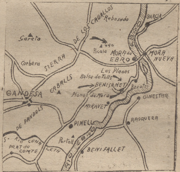
CROQUIS DEL MAPA DE OPERACIONES DEL EBRO.— LAS FLECHAS NEGRAS INDICAN LOS ULTIMOS AVANCES DE LAS TROPAS DE FRANCO

El cinismo de los rojos llega hasta extremos inverosímiles. Nosotros nos alzamos contra esta villanía. La Santa Sede no puede firmar la paz con los que han destruído los templos y han asesinado a los sacerdotes.