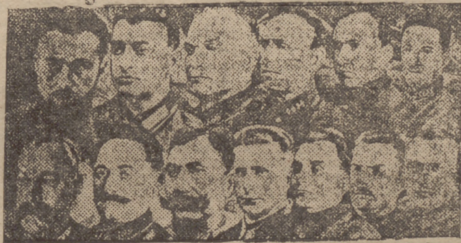
EL QUE FUE CONSEJO MILITAR REVOLUCIONARIO DE LA U. R. S. S.

De izquierda a derecha, arriba: Gamarnik, suicidado (o ejecutado); Toudalchevski, ejecutado; Egorov, ejecutado; Kalapski, desaparecido; Orlov, ejecutado; Lakir, ejecutado. Abajo: S. Kamenev, muerto; Ordjonikidze, envenenado; Boudioni, sobreviviente; Aiskins, ejecutado; Modklovitch, ejecutado; Eideman, ejecutado; Onhorevitch, ejecutado. (Fotomontaje soviético anterior a las ejecuciones)