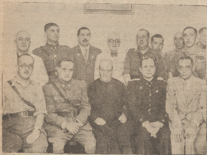
Grupo de concurrentes a la bendición del local de la Hermandad de Ntro. Padre Jesús de la Agonía y María Santísima de las Penas.

El acervo religioso de Málaga va teniendo poco a poco su máximo exponente de expresión, y no pasa día sin que una nueva manifestación de la catolicidad venga a ocupar el primer plano, entre las muchas actividades, que el renacer de Málaga reclama en todos los sentidos.