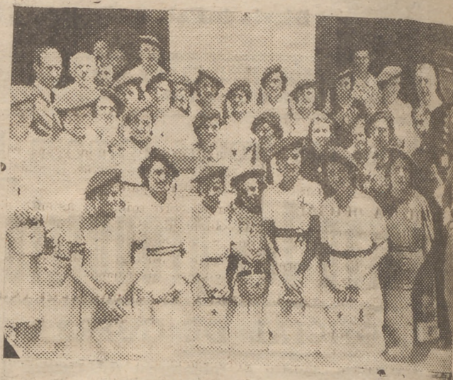
Grupo de bellísimas señoritas portuantes en la fiesta de la Banderita, celebrada ayer.

Se celebró con brillantez, siendo su recaudación muy fructífera