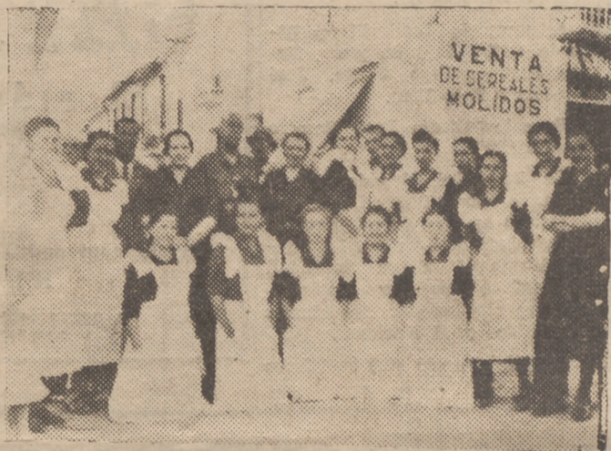
Un grupo de falangistas de la localidad posan para Boinas Rojas rodeando a las autoridades locales

A continuación tuvimos la satisfacción de trasladarnos, acompañados de las autoridades, a la Plaza de las Carmelitas. En aquel lugar gráficamente ocupamos sitio en agradable tertulia, ante el Parador de los Caballeros. A la fronda del árbol de Frasquito—como lo llama el pintoresquismo local—departamos mientras se efectuaba el traslado del obligado refresco, comenzando ya los comentarios sobre esa novillada benéfica que ya se "mascó", pues el ambiente de la llegada del "botijo" y de los camiones especiales, son síntomas clarísimos que predisponen a una tarde de toros tan clásicas y tan celebradas en esta localidad y en esta plaza chiquita y simpática de Vélez-Málaga.