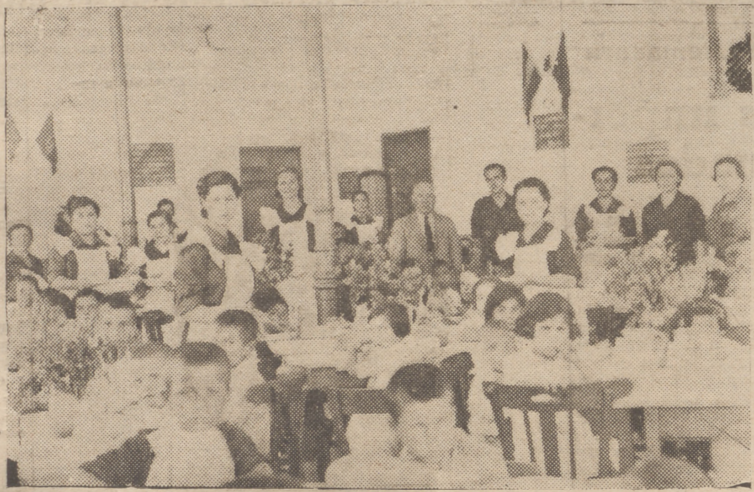
El amplio comedor del Auxilio Social de Velez durante la comida extraordinaria del domingo

Todos ellos personas destacadas de la localidad que esforzada y patrióticamente llevan esta primordial tarea municipal en bien del Velez, del buen nombre de Málaga y de los mejores anhelos de la nueva España.