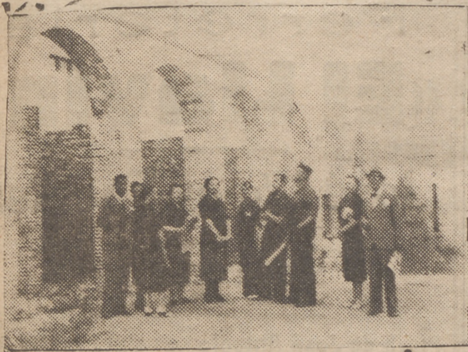
Las autoridades municipales y de Falange visitando las obras del nuevo Mercado