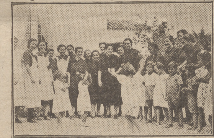
En el Hogar Azul, ante Pilar, las criaturas que allí reciben el beneficio de la Falange, bajo la demostración de sana alegría

Jefe provincial de la Sección Femenina, Delegada provincial de Auxilio Social, secretario, camarada