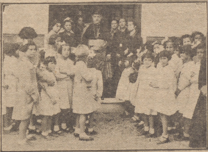
Un momento de la visita del señor Obispo al "Hogar Rosa", otra de las magnas obras de Auxilio Social en Málaga (Información en la tercera plana)