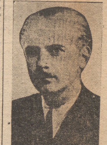
La vida de veinte millones de españoles nunca más habrá libertad.

LA RELACION DEL MOVIMIENTO Y EL ESTADO. —¿Qué relación hay entre el Movimiento y el Estado? —La relación se produce a través de una identidad de pensamiento y de propósito. El Estado es el ímpetu y a la vez la base firme del Estado. "El Estado, a través del Poder ejecutivo, significa la capacidad de realizar las posibilidades más interesantes del pensamiento y del tono nacional del partido. "LA MISION DE LA PRENSA. —En la nueva organización, ¿qué misión corresponde a la Prensa? —No podía perdurar un sistema que se consideraba a la Prensa como un "cuarto" poder indiscutible. Siendo órgano importantísimo de opinión y de cultura, no puede vivir al margen del Estado y ha de sentirse parte integrante de la unidad moral y política que es la Nación.