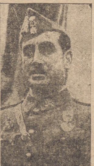
General García Valliño

Continúa el avance de nuestro Ejército por la costa mediterránea