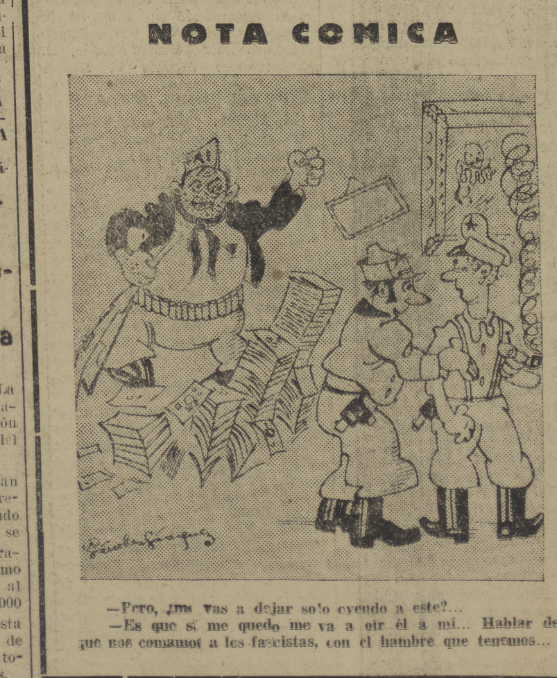
—Pero, ¿tú vas a dejar solo creando a este?... —Es que si me quedo me va a ir él a mí... Hablar de que nos comamos a los fascistas, con el hambre que tenemos...