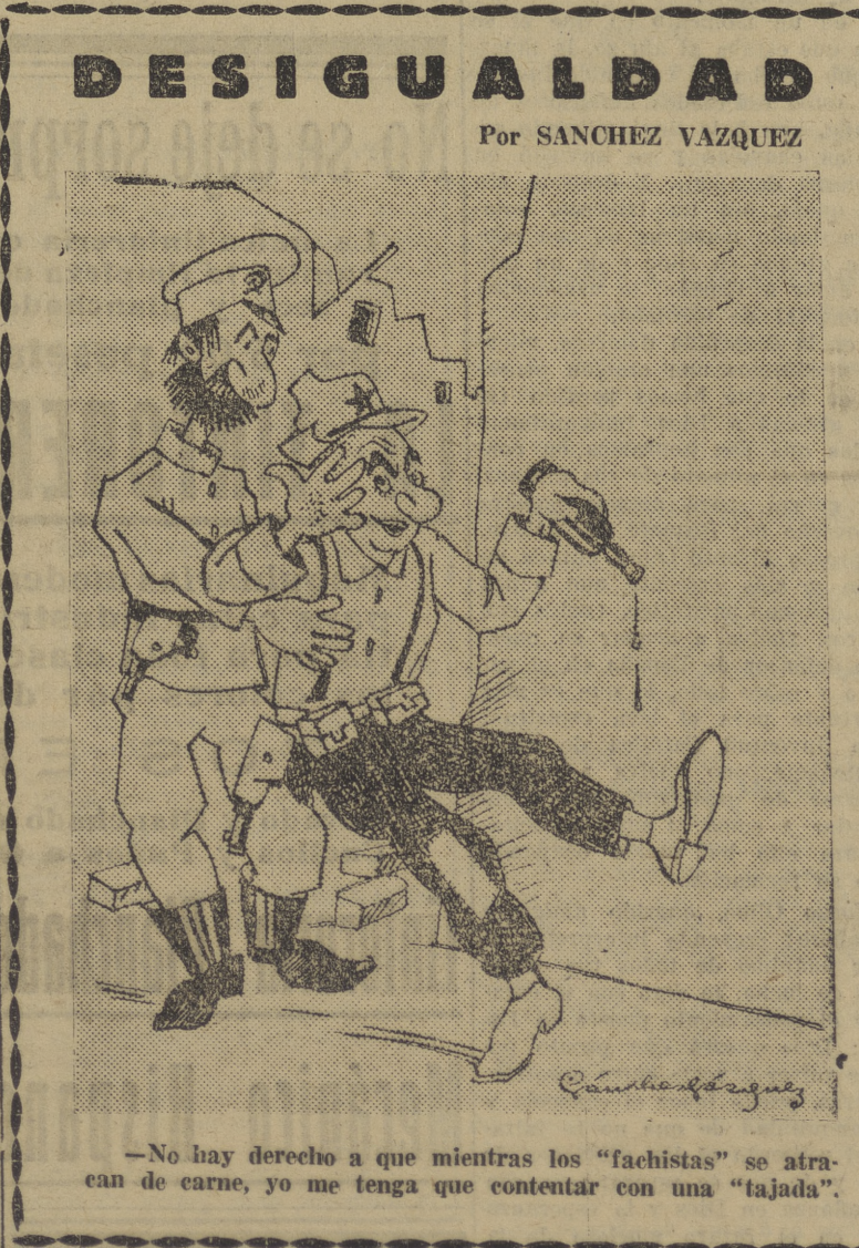
—No hay derecho a que mientras los "fascistas" se atraen de carne, yo me tenga que contentar con una "tajada".

También se sigue la campaña contra los anarquistas, que son detenidos por grupos y fusilados sin formularse causa.