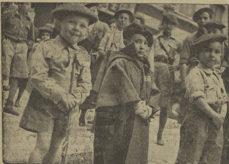
El orgullo de ser «pelayo» muéstrase en cada uno de los rostros de estos niños malagueños.