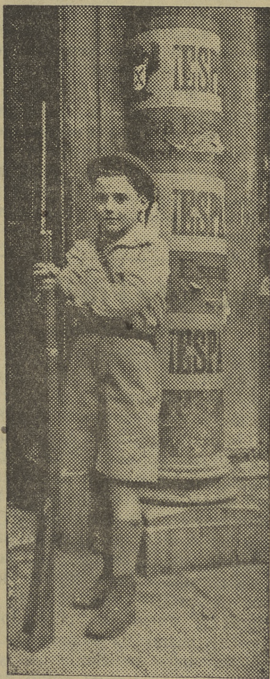
Serio, imperturbable, como un verdadero soldado, este «pelayo» monta la guardia a la puerta de su cuartel.

Don Pelayo, el Rey Cristiano, que al frente de un puñado de astures y bajo el signo de la Cruz inició en las montañas de Covadonga la grandiosa epopeya de la reconquista de