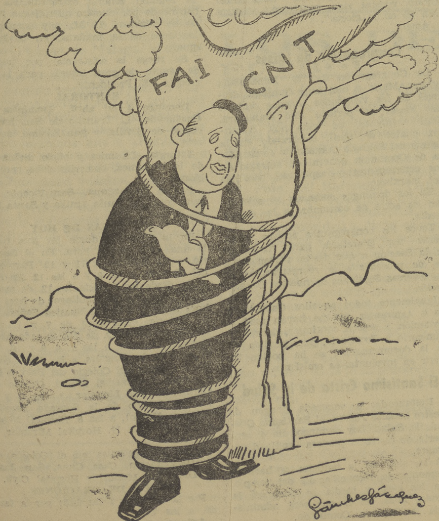
—Prieto.—Nada, así no hay modo de salir «pirando».