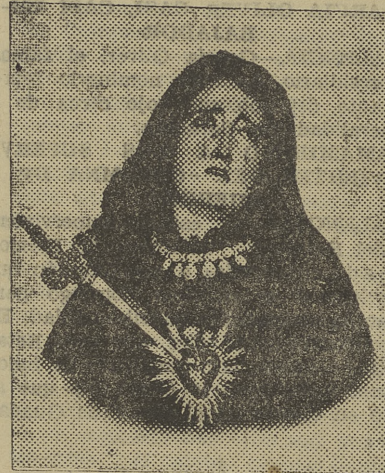
Venerada imagen, salvada milagrosamente.