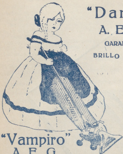
"Vampiro" A. E. G. LIMPIA TODO SIN TRABAJO ALGUNO

"Dandy" A. E. G. GARANTIZA BRILLO ESPEJO