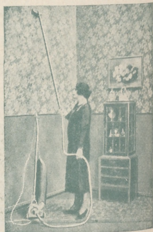
“Dandy” A. E. G. GARANTIZA BRILLO, ESPEJO