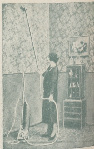
“Dandy” A. E. G. GARANTIZA BRILLO Y ESPEJO