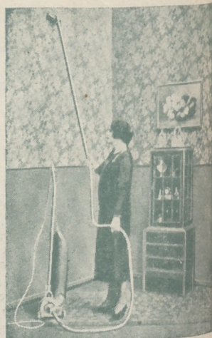
“Dandy” A. E. G. GARANTIZA BRILLO ‘ESPEJO