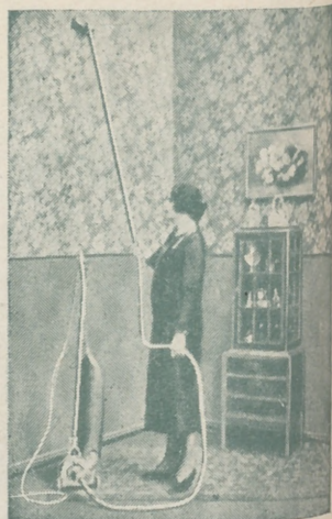
“Dandy” A. E. G. GARANTIZA BRILLO ‘ESPEJO