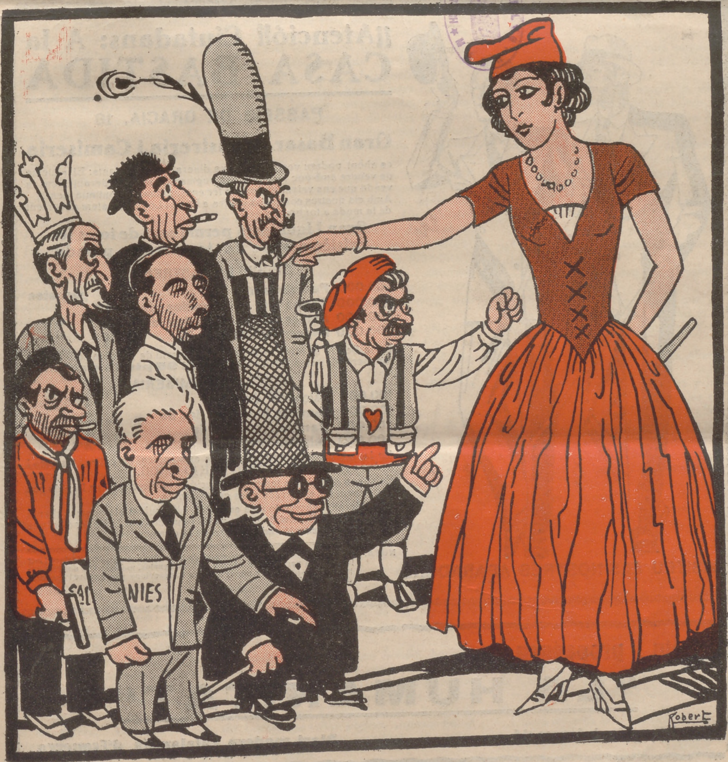
- Tots contra l'Esquerra!