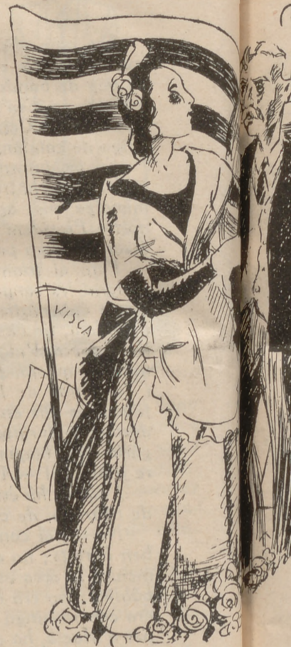
—Caram, caram! Ais poso

Això, poble de Catalunya, no deus oblidar-ho. Quan el senyor Cambó, en mítings i conferències, et digui que ell no ha estat mai monàrquic, digues-li a la cara que menteix. Recorda-li la seva conxorxa amb el duc de Maura, amb en Silió, amb en Goicoechea i