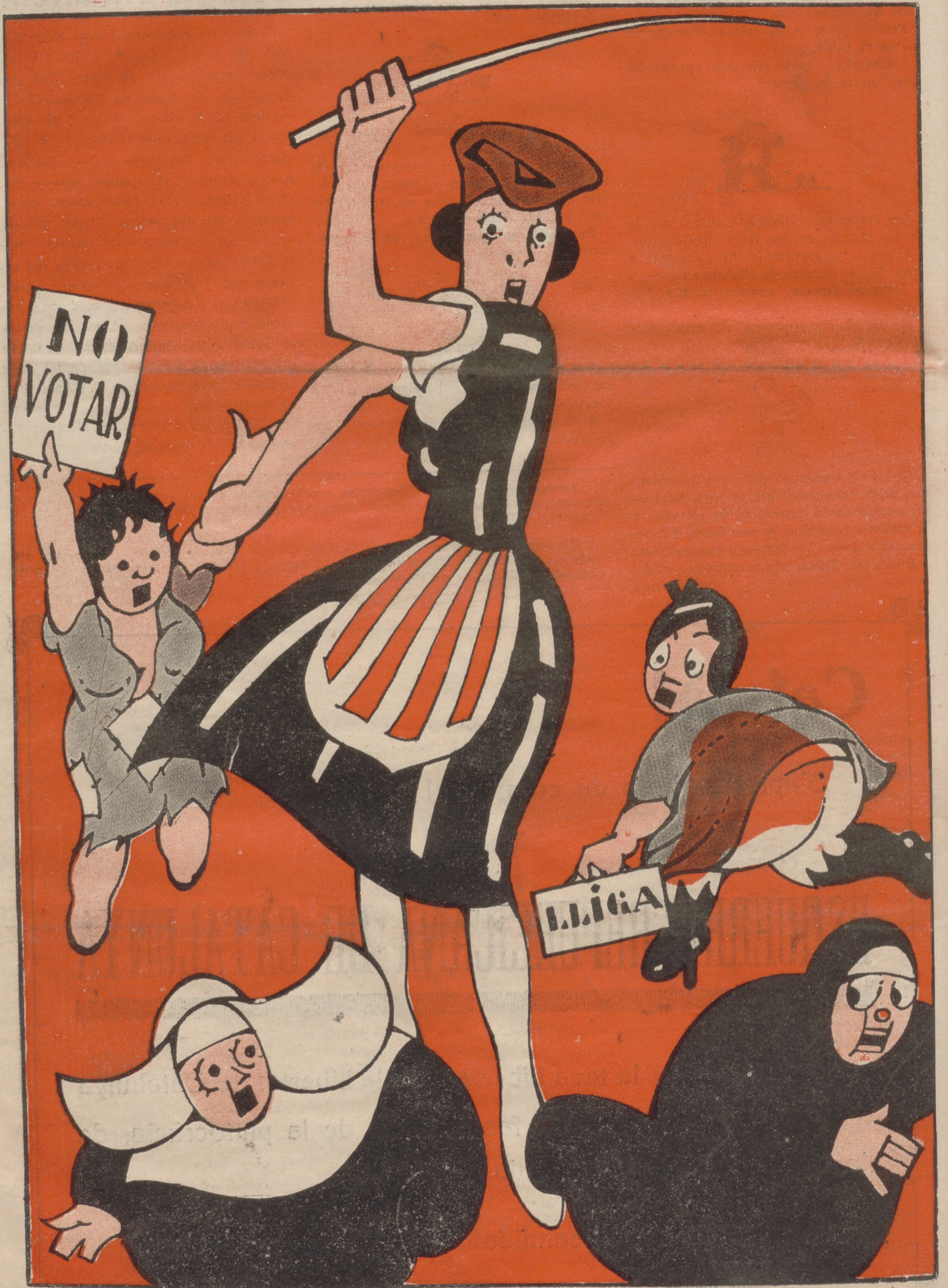
-I doncs, que no hi pensaven en mi?