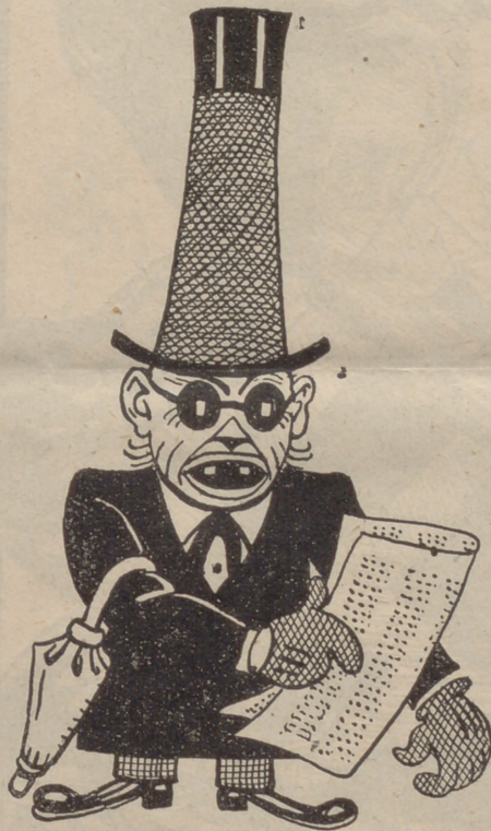
El senyor Esteve

Si reviséssim la nòmina de les grans Companyies — i no parlem de l'administració pública! — trobaríem molta gent d'aquesta. En temps de la monarquia, els ministres i els direc-