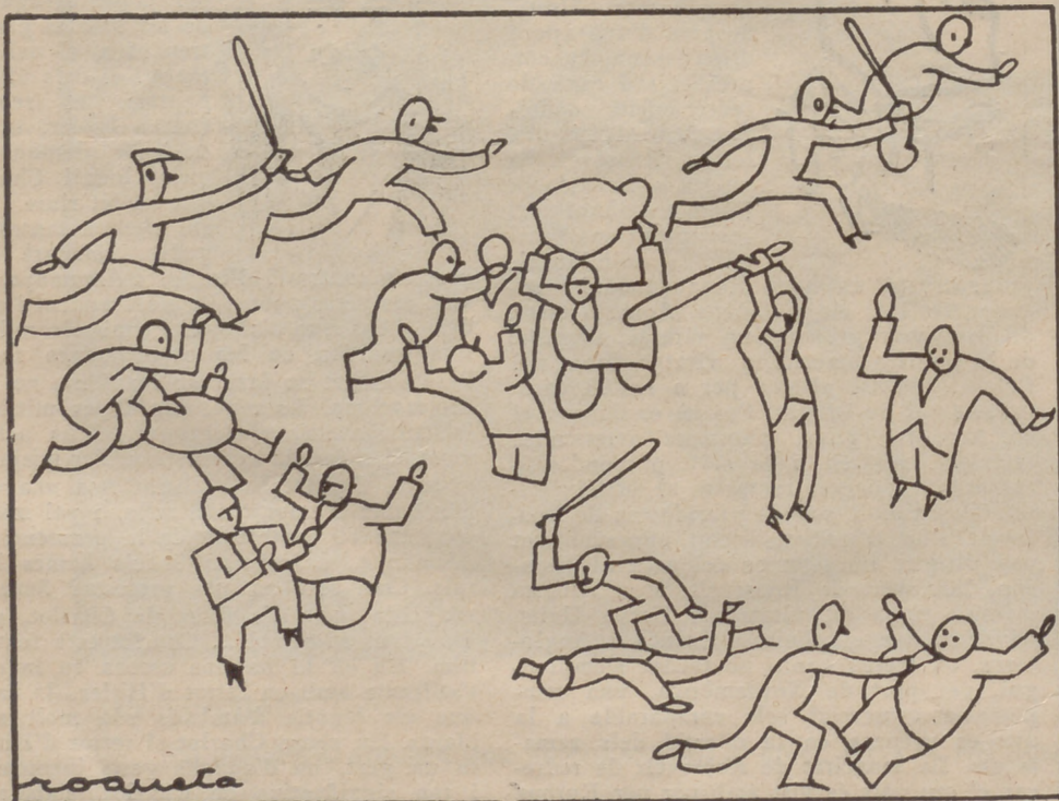
El paradís d'Andorra

La joventut andorrana, avui, no pot transigir amb la supervivència feudal