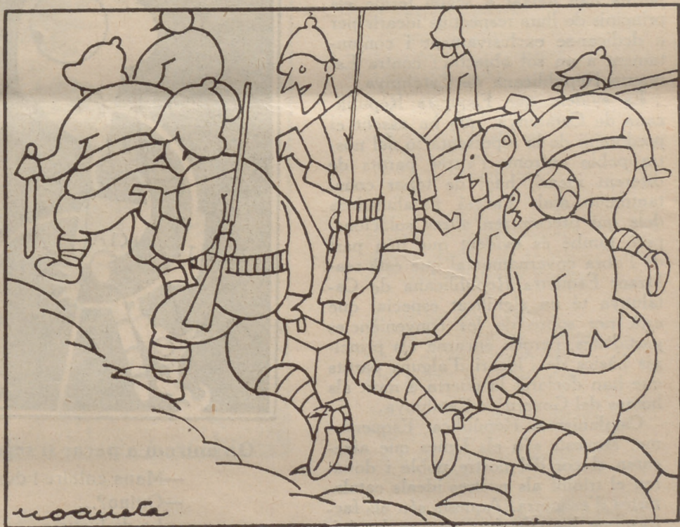
«Andorra - Atraction»

Sabem, però, quina cosa són els «drets» adquirits. I més quan qui els ha adquirit és una nació poderosa. No té encara la justícia estricta prou defensors per a imposar-se contra tot i contra tots. Transigim, doncs, amb la «protectora influència» francesa. Del mal, el més petit. Té un caràcter