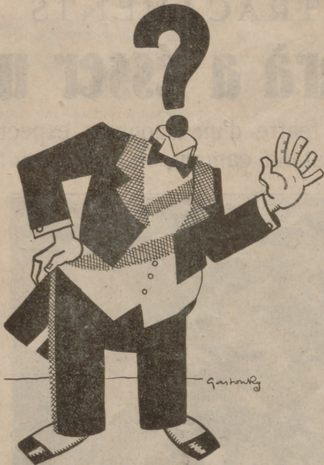
La presidència de la República Es necessita un cap. Qui serà aquest.

Poc després, es presentaren els quatre policies, i un de la banda cridà: "Miralos; aquí estan". I acte seguit, se sentí un raig de trets.