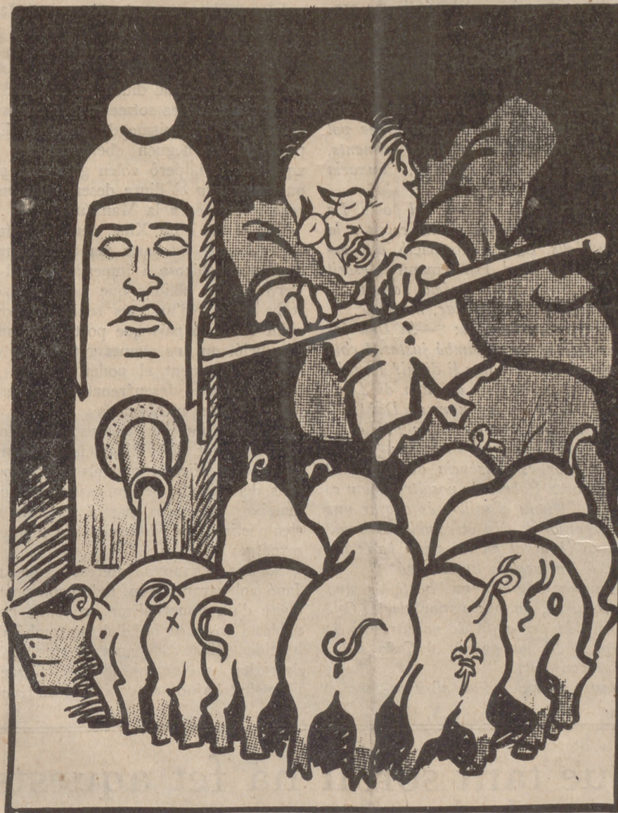
—Atipeu-vos, atipeu-vos, porcellets, que a cada puercu le llega su San Martín...

Col·labora, amb altres "barandes" del seu