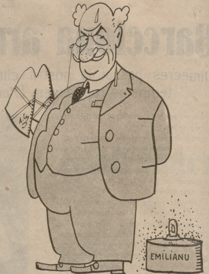
En Lerroux:—I quin pes m'he tret del damunt

Cada dia hi ha més militars retirats que prenen part en aldarulls i complots contra la República.