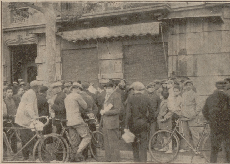
La façana del bar del carrer d'Urgell cantonada al Consell de Cent, on tingueren lloc els successos.

La camioneta que anava la policia pogué passar davant del cotxe, i se li travessà al camí, el que obligà al propietari del primer cotxe a parar.