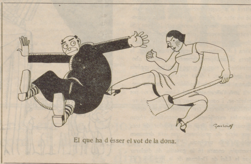
El que ha d'ésser el vot de la dona.

Segons l'empresari, que les obres que es posaven en escena — i eren obres de bons autors, aplaudides per tots els públics — no cridaven l'atenció.