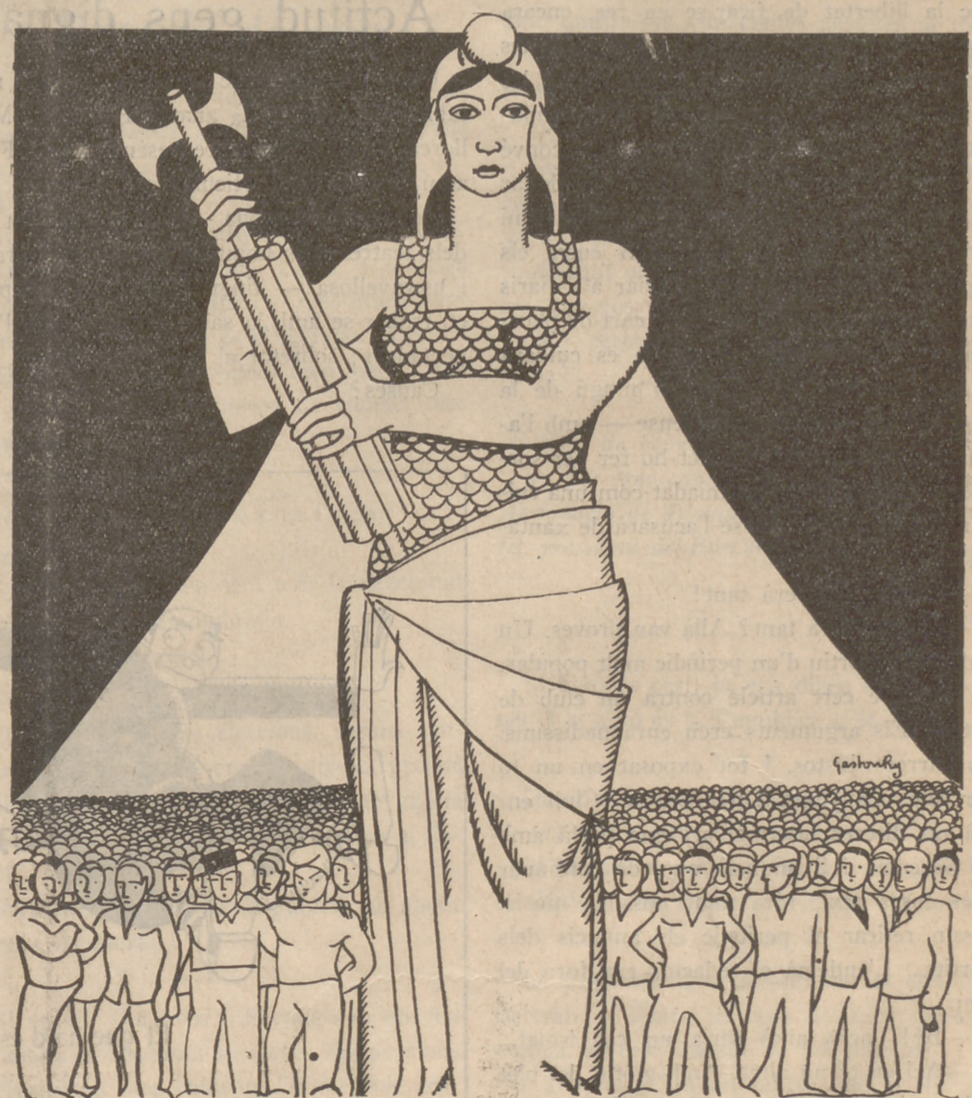
La República ha salvat el poble... i el poble salvarà la República

d'un artefacte a la Plaça del Rei a Barcelona, i d'algun atracament a mà armada han aixecat el crit al cel, sostenint la teoria que, d'ençà del 14 d'Abril, el poble viu en inquietud constant. I voldríem saber nosaltres si aquestes exclamacions no són també un atac al règim, un foment de la desconfiança, un desig d'esperuguir la gent. Si l'extrema esquerra provoca vagues revolucionàries sense to ni so, excita a la indisciplina i il·lícitament posseeix armes de foc, la dreta té uns procediments no menys abominables, i suspèn sense justificació prèvia les indústries, i dona notícies falses, i declara el boicot a la República — com ha succeït amb l'abonament del Liceu, que no pot cobrir-se, i constantment desacredita els republicans sincers, fent remarcar unes determinades excel·lències del putrefacte règim monàrquic, que fou el provocador de tota una sèrie de problemes que ara demanen solució amb urgència. "El Debate", per exemple, encara té la gosadia de declarar que la Llei de Defensa de la República és una mortífera arma contra les llibertats le-