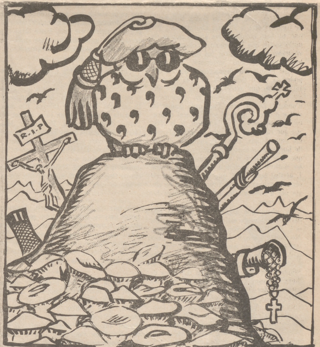
Aquest any, els bolet seran verinosos. I per cert que sembla que n'hi haurà a dojo.

En nom de quin dret demanen la llibertat, aquests capellans que fins ara han estat els amos i senyors?