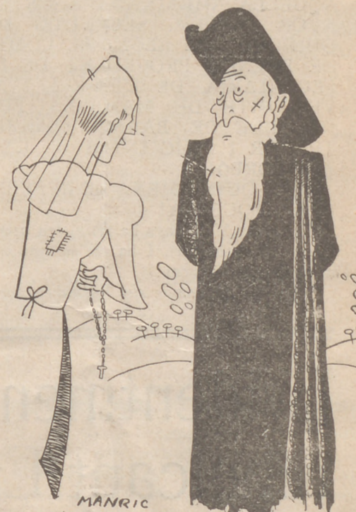
—Vaig prometre deixar-me la creïxer fins que tornés la monarquia; però em sembla que ho hauré de deixar córrer.