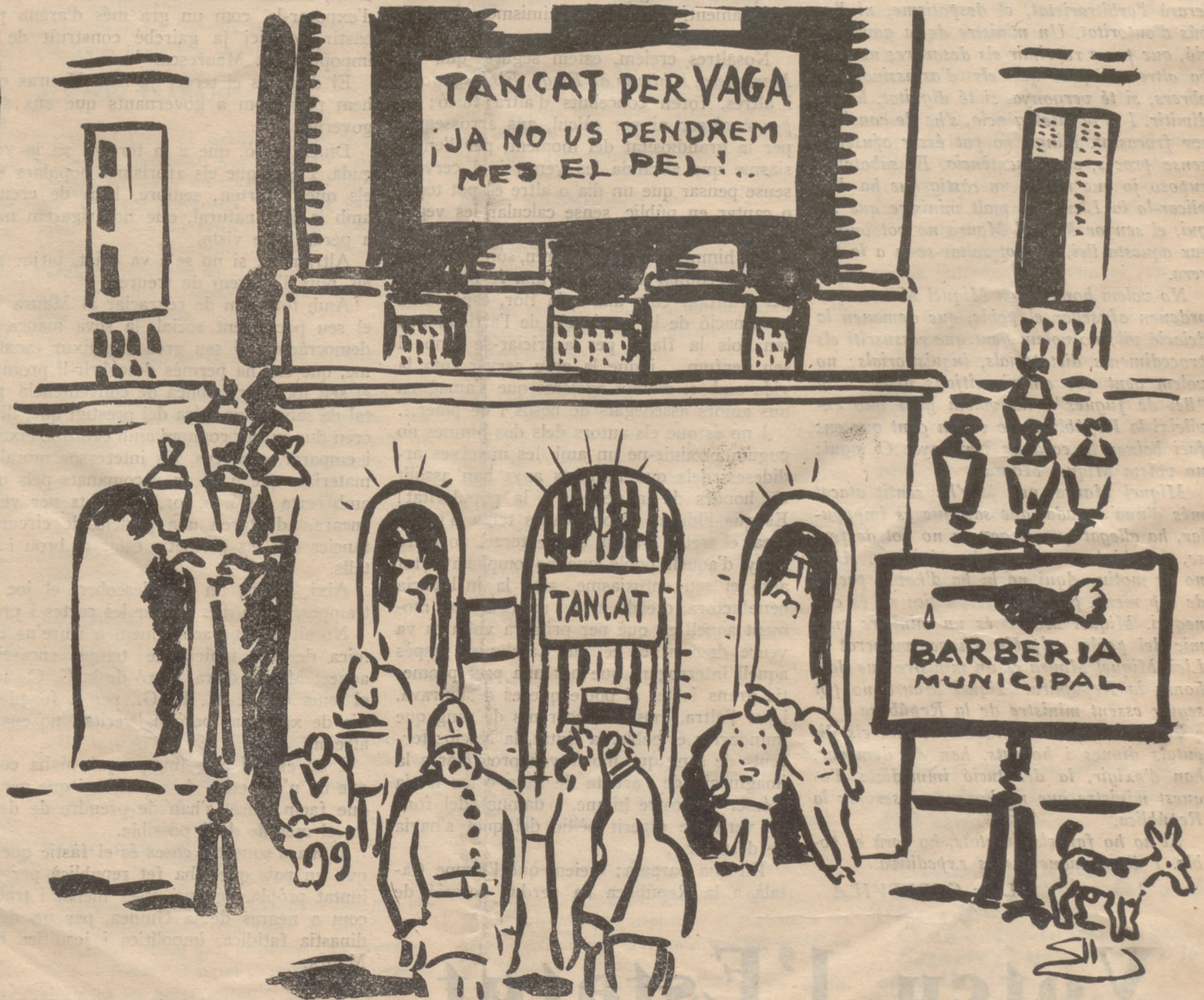
—Potser algun dia el poble els pelarà al zero...

Què s'ha cregut, el ministre Miquel Maura? Què està de governador en una colònia