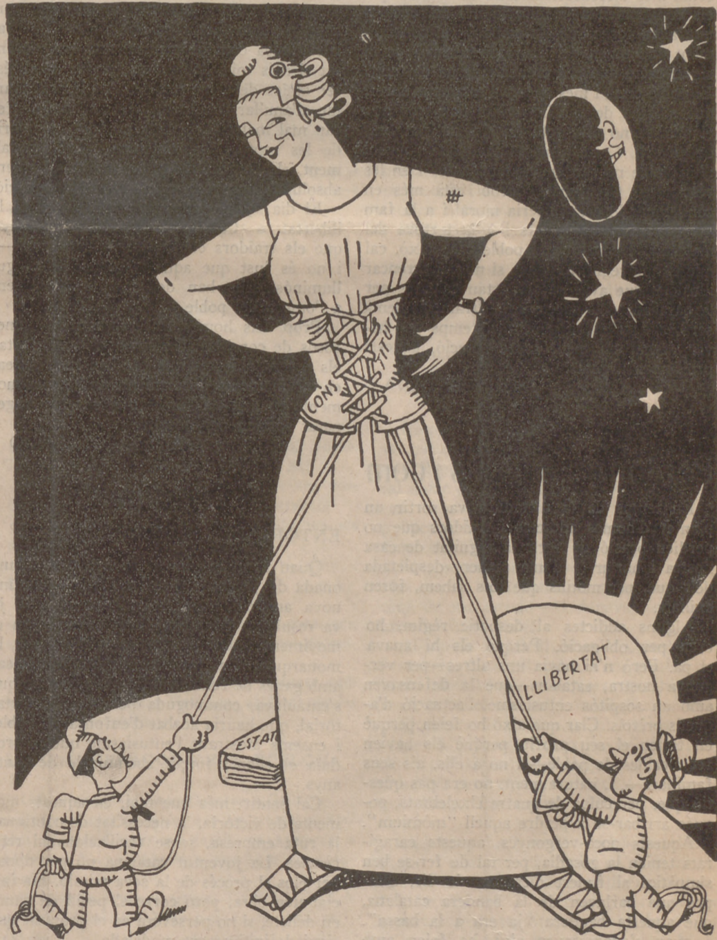
—M'estrenyeu massa la cotilla, i em sembla que farem barrila!

Jo, però, com sento envers vosaltres un afecte sincer i voldria que les autoritats de la República us donessin feina, us he trobat una solució. Encara que us sembli es-