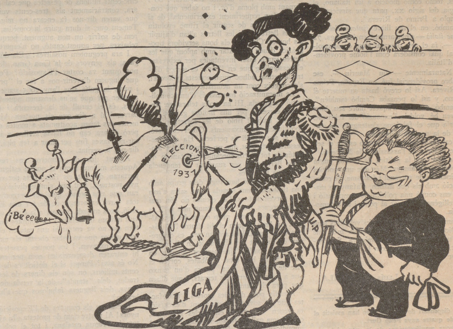
De la mandanga nacional:

I, no obstant, Cambó, la política del qual davant de Catalunya havia d'ésser la d'un complet desacord amb la Dictadura, no podia dissimular el seu afecte envers la Dictadura. Cosa que demostra que Cambó no és