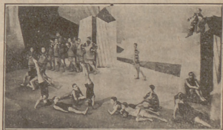
La chauve souris

La companyia de ballets russos "La chauve souris", que dirigeix l'intelligent i expertíssim Nikita Balieff, ha estrenat a Londres un nou ballet: "Le train bleu". Aquest ballet és una visió de Trouville, una de les platges més elegants del món, i no té altre motiu que el de les gentils evolucions dels ballarins.