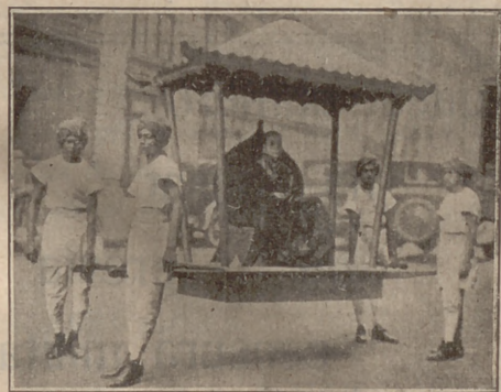
Una princesa javanesa a New York

Fullejant revistes, angleses, franceses, alemanyes, hem triat aquestes fotografies. Aquestes fotografies representen a uns "lamas", o si-