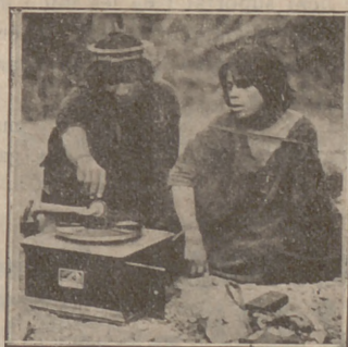
Els indians i el gramòfon

Perquè la civilització no consisteix principalment en les cases de trenta pisos amb ascensor, telèfon i quarto de bany; ni en les grans avingudes; ni en la profusió de cafès, "music-halls" i teatres; automòbils i metropolitans. La civilització és una cosa més íntima, més entranyable: és la simpatia, la comprensió, és l'educació, és la bondat. I això es troba en el cor i en el cervell dels homes, però