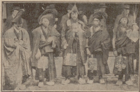
Uns lamas del Tibet a Londres

I què pensaràn aquests bons i simpàtics salvatges—bons i simpàtics per això: perquè són salvatges, que no per altra cosa—del fonògraf, aquesta odiosa màquina lírica? Quin concepte en tindran? Quin efecte els farà aquella ronquera? El fonògraf és el present que la ci-