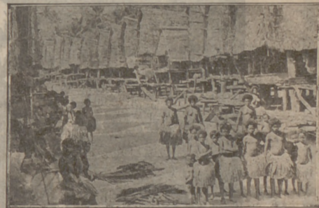
Els salvatges de Nova Guinea.—Un carrer.

Torneu-lo a llegir que no us recarà. Els llibres d'aventures són, avui com avui—que estem podrits per una literatura de cabaret idiota—una de les lectures més sanes.