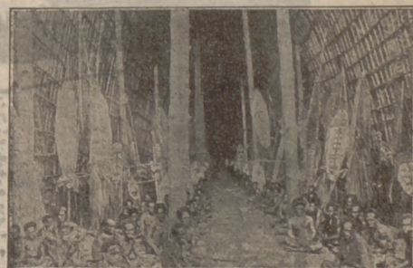
Els salvatges de Nova Guinea.—Una casa.

Torneu a llegir el Robinson... o aneu-se'n a fer un viatge a la Nova Guinea. Per aquestes fotografies que reproduim, creiem que l'obscur poblat