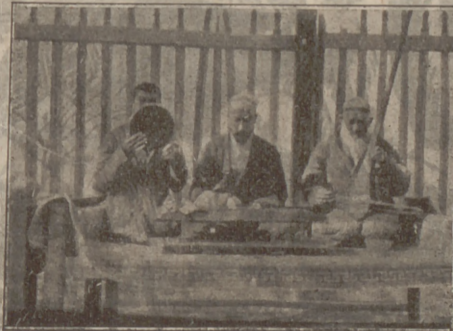
Una orquestra típica

A la Xina es barallen ara dos exèrcits: l'exèrcit A i l'exèrcit B. Comanden aquests exèrcits el general A i el general B. Sembla que això és lo que, actualment, interessa més de la Xina. A nosaltres no ens interessa, però. Nosaltres creiem