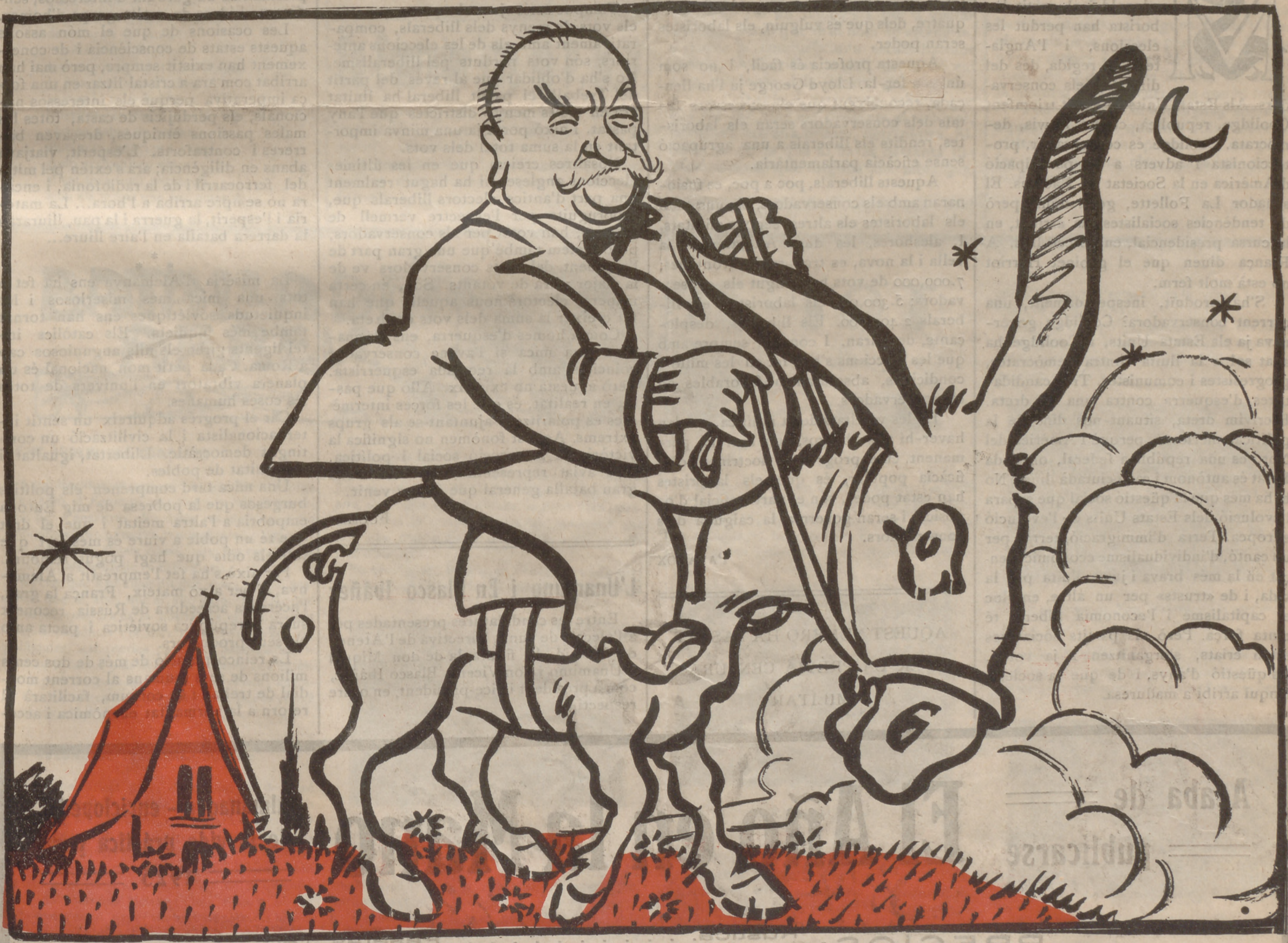
—Sembla mentida, som gairebé a gener, i quin bon temps que fa.