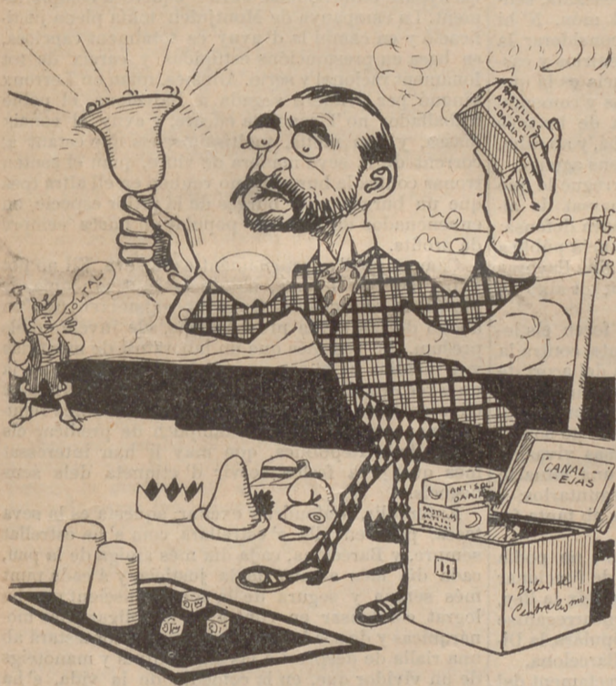
L' incansable Canalejas segueix fentse el seu reclám.