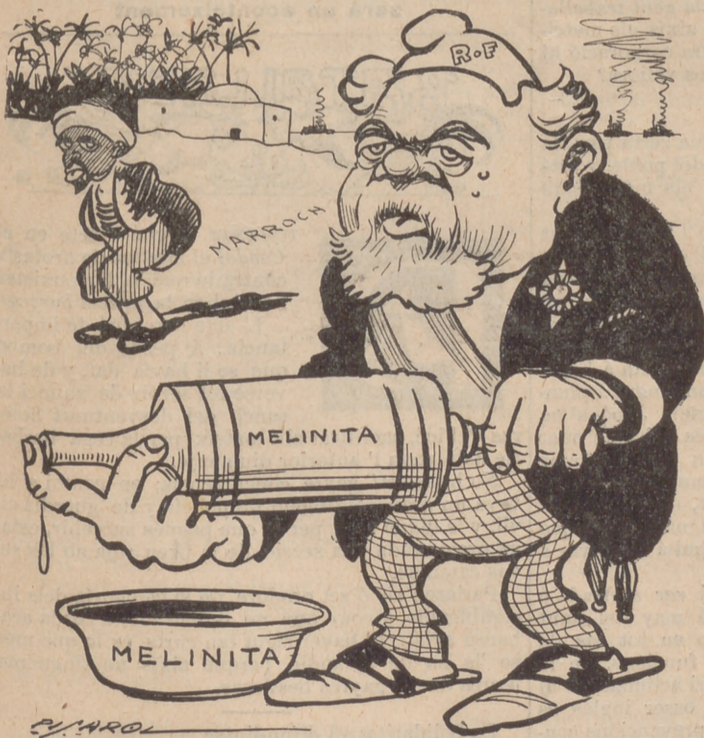
La penetració pacífica té un éxit fenomenal.