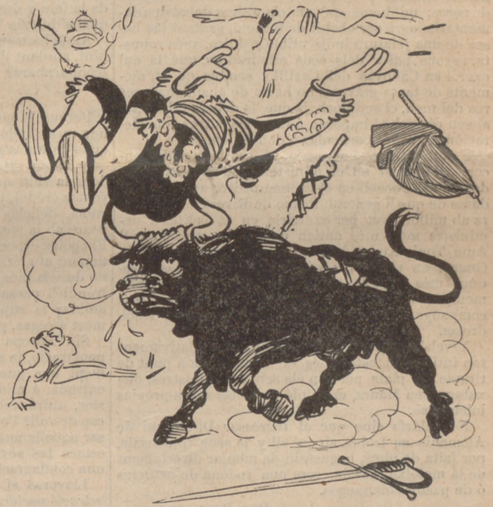
Els toreros van en l' ayre sense globo y sense gas.