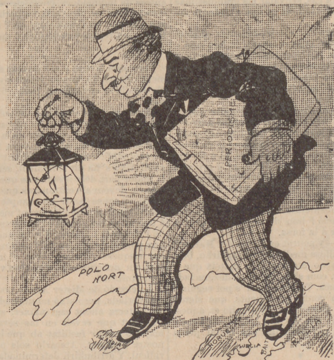
Y en tant uns buscan á en Maura, que sembla que s' ha esgarriat,