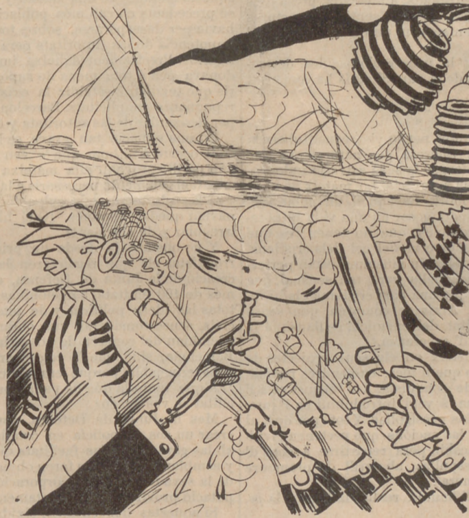
A San Sebastián celebran una festa cada quart.