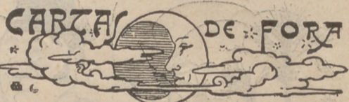
CAPELLADES, 12 de agost

Davant d' ell els gossos pataners, no tenen més remey que corgolarse, ficantse la quá a la boca y la llengua dessota de la quá.