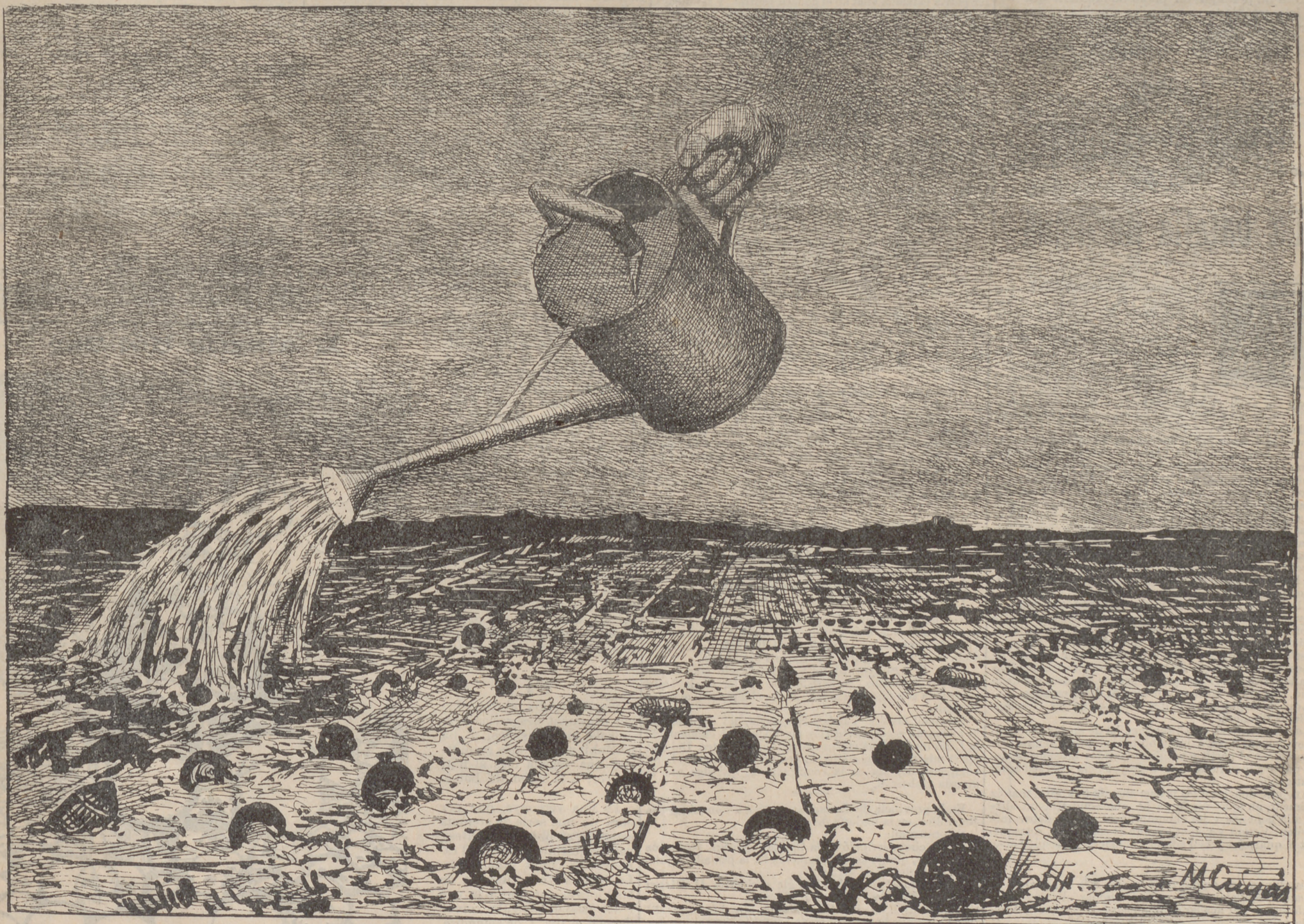
Aquesta má que 'l rega ¿de qui es?