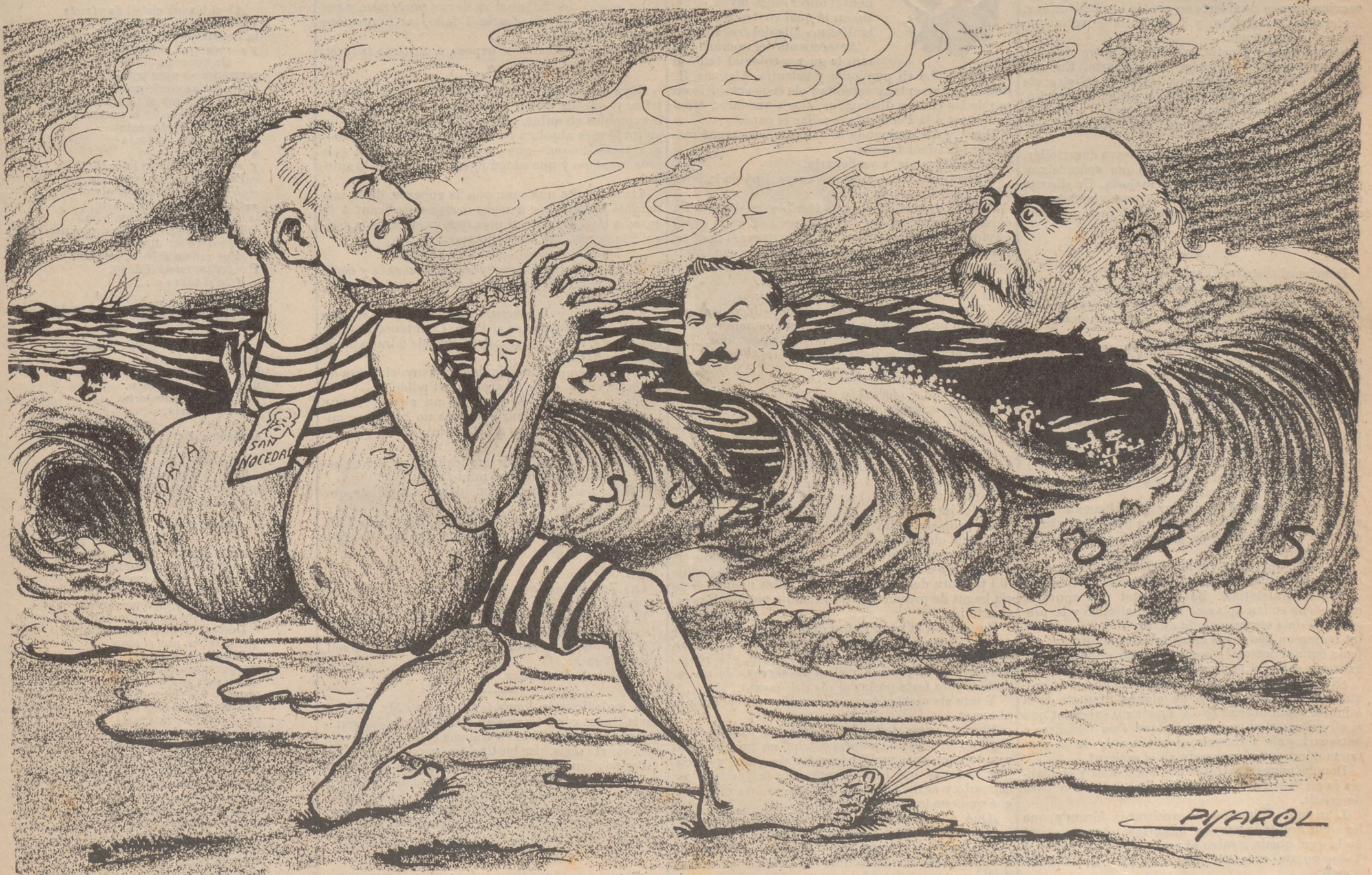
—¡Recristinal... Está massa alborotat aixó!... Decididament, no m' hi fico.