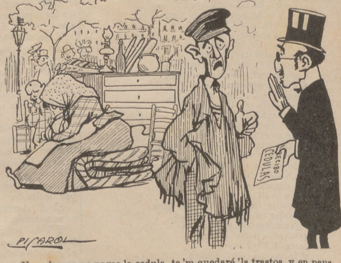
—Noy, ja que no pagas la cedula, te 'm quedaré 'ls trastos, y en pau.