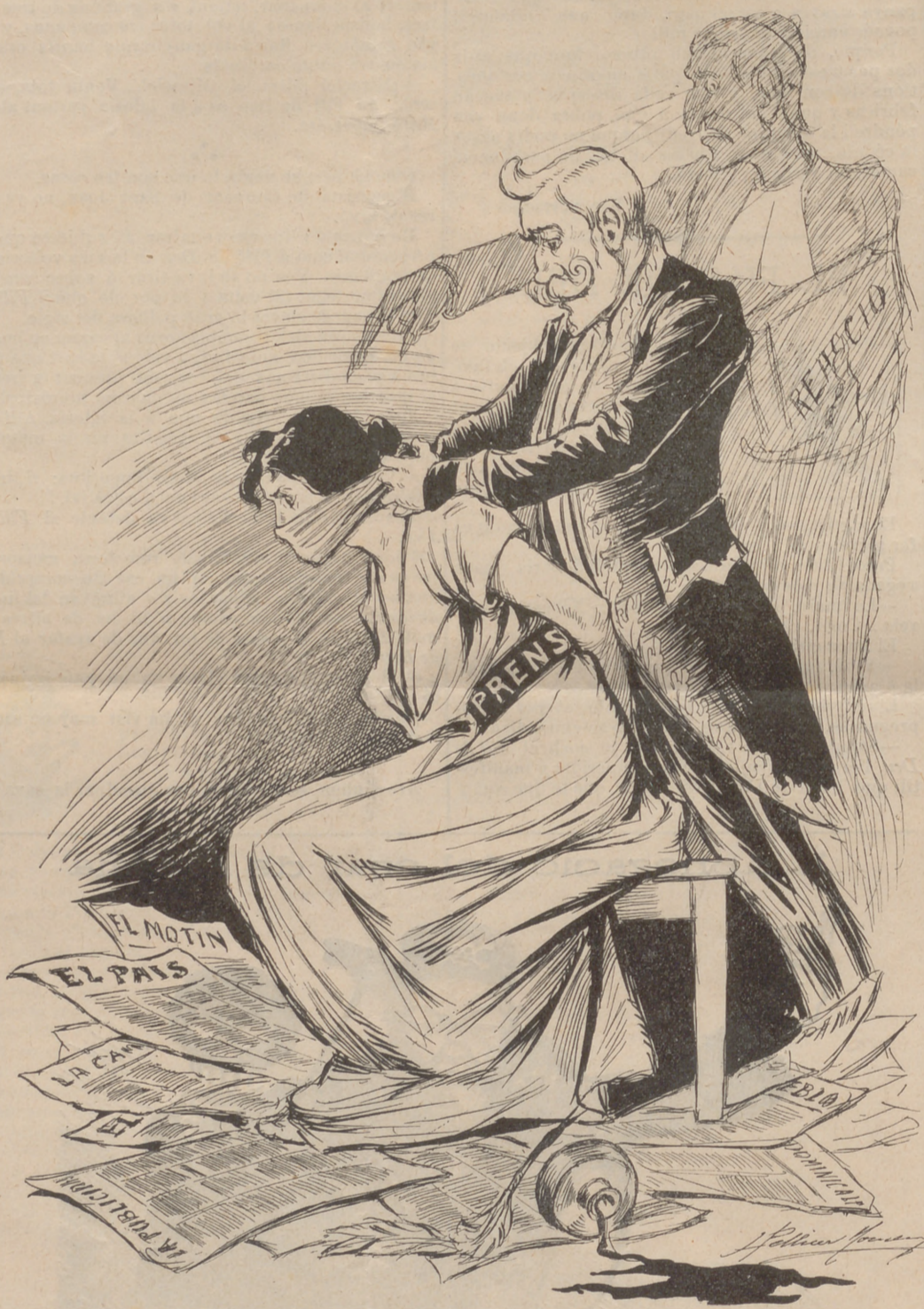
Tapabocas d' estiu.

Una hu-dos-terza no prima tercera cap mal, allá