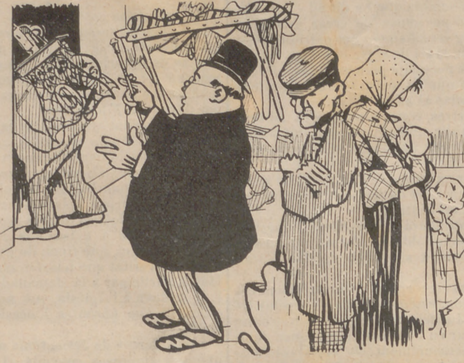
—Noy, com que 'm deus dos mesos de pis, t' haig de plantar els trastos al carrer.