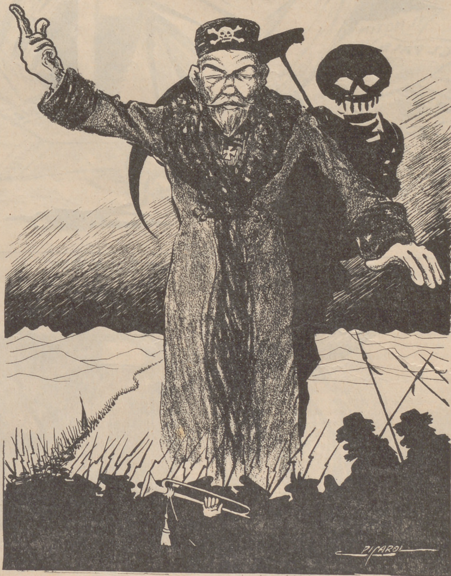
—¡Ánimo, soldados meus!... Mentres vosaltres aneu a la Mandxuria a morir per mí, jo m' quedo aquí resant per vosaltres.

nicaril un assumpto celestial de la major importancia.