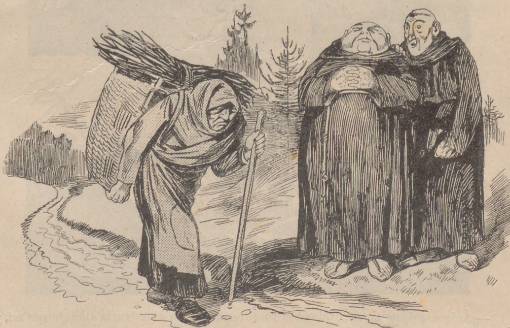
LAS CIGALAS Y LA FORMIGA

—Traballa, vella, traballa, que quan acabis las forsas, nosaltres, en recompensa, ja 't cantarem... las absoltas.