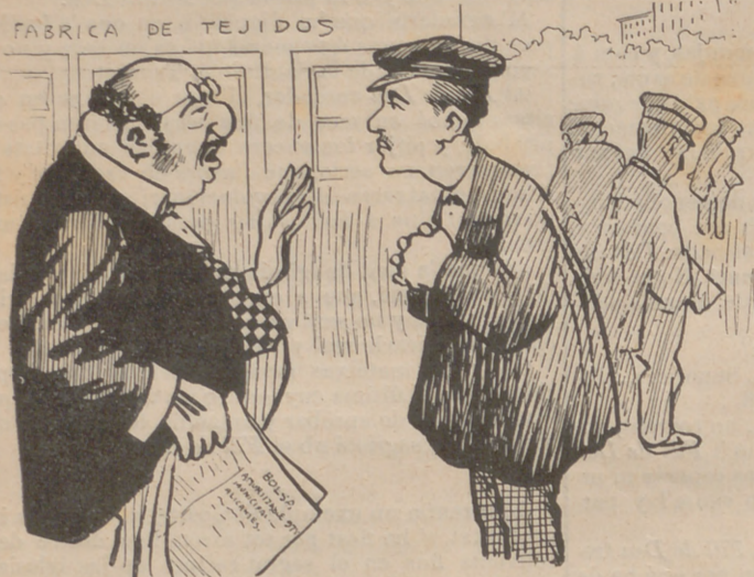
—Noy, no hi ha feyna; ab aixó quedas despatxat.