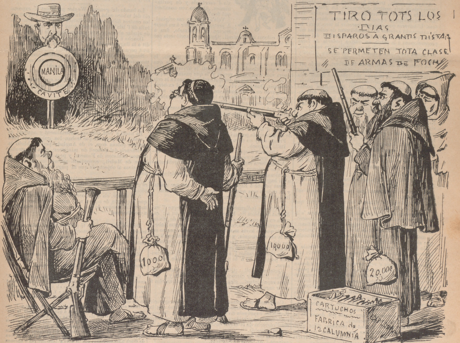
Tiro al BLANCO