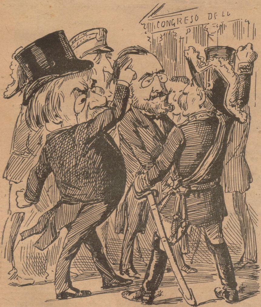
Los canovistas quan aixó saben ab ira cridan:—No hi haja pau.