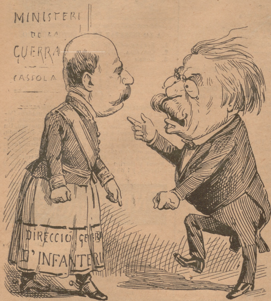
—A tú tots t' hem elegit per moure la gran bromada...