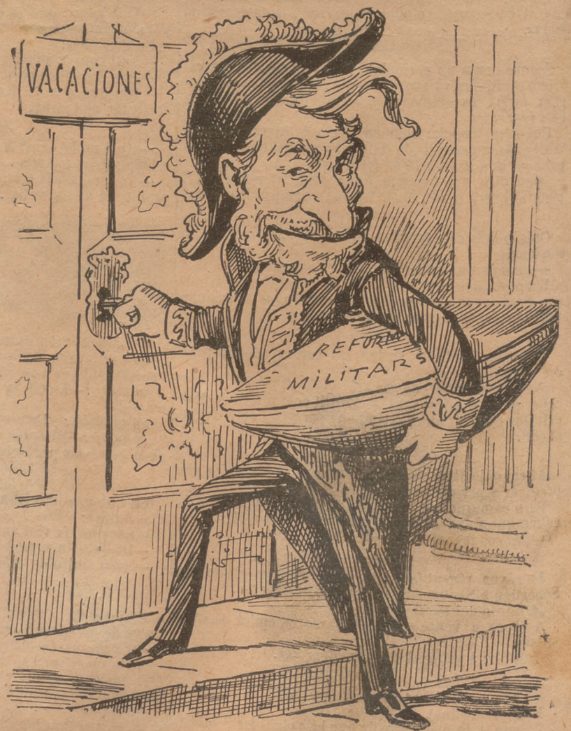
Y en tant D. Práxedes pren la cassola, tanca la porta, y—Adéu siau!