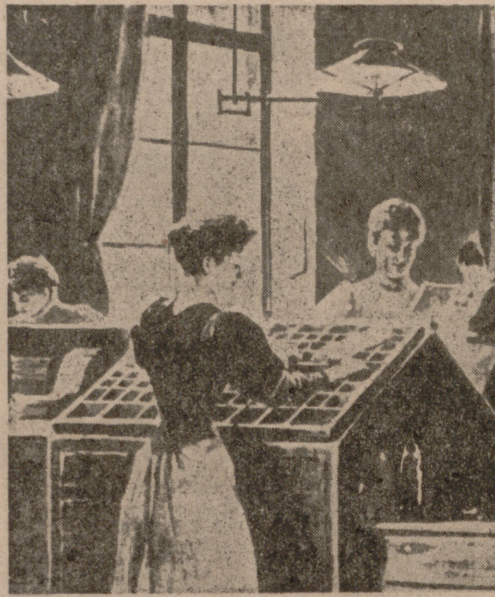
La revalorización del trabajo femenino será para la causa feminista motivo importante en sus conquistas. Las mujeres han descubierto por fin horizontes nuevos para su existencia cotidiana que, por otra parte les permitirá una mayor independencia económica.

La aceptación del hecho de que las mujeres podían esperar del matrimonio algo más que rendir de vez en cuando un tranquilo y mudo homenaje a Inglaterra, es sin duda uno de los cambios mayores en la posición femenina, de los últimos dos siglos. Pero al mismo tiempo ha llegado el gas, la electricidad y otras muchas conquistas científicas y técnicas pue-