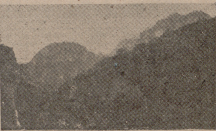
Ballestar. La Tenalla. Entre estas montañas, donde los Reyes de Cataluña, Valencia y Aragón dialogaban, decían, «sin salir de sus reinos», se reunían los bandoleros, aprovechando la ventaja estratégica del lugar.

Los hombres de la Guardia Civil, encargados de su represión, coroneles y generales hoy, iniciaron de esta manera el operativo que iba a culminar, siete