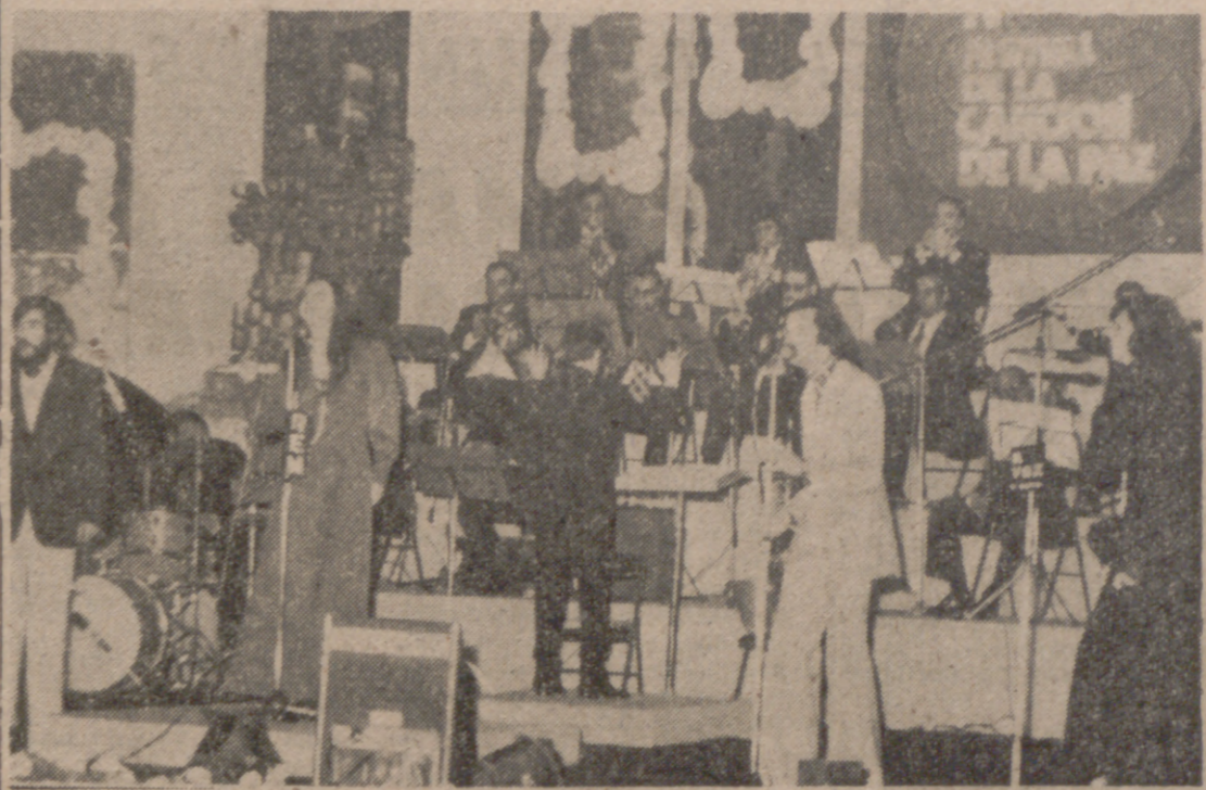
Se celebró ayer en el Teatro Cal Lerón la apertura del IV Festival de la Canción de la Paz, que organiza "La Voz de Valladolid". El público, que llenaba la sala, siguió con interés la interpretación de las dieciocho canciones seleccionadas. Hoy tendrá lugar la gran final.—(Información en pag. 5.ª)