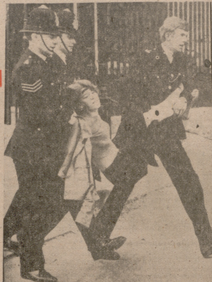
Todaya en nuestros días las mujeres siguen demandando públicamente sus derechos.

Tras la Guerra Civil, hacia 1869, se había creado ya en los