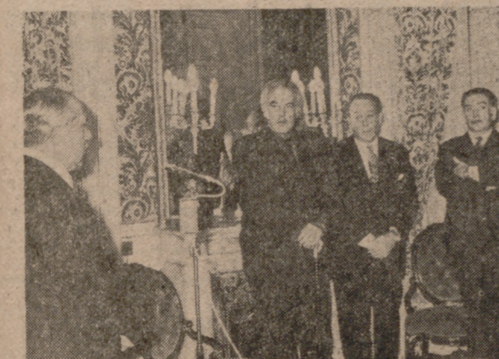
MADRID.—En la primera fotografía, el jefe del Estado durante la audiencia concedida en el Palacio de El Pardo a la Junta Nacional de la Confederación de Hermandades y Asociaciones de Excombatientes de España, presidida por don José Antonio Girón de Velasco, consejero del Reino. En las siguientes fotos, dos momentos de las visitas al Príncipe y al Presidente del Gobierno.