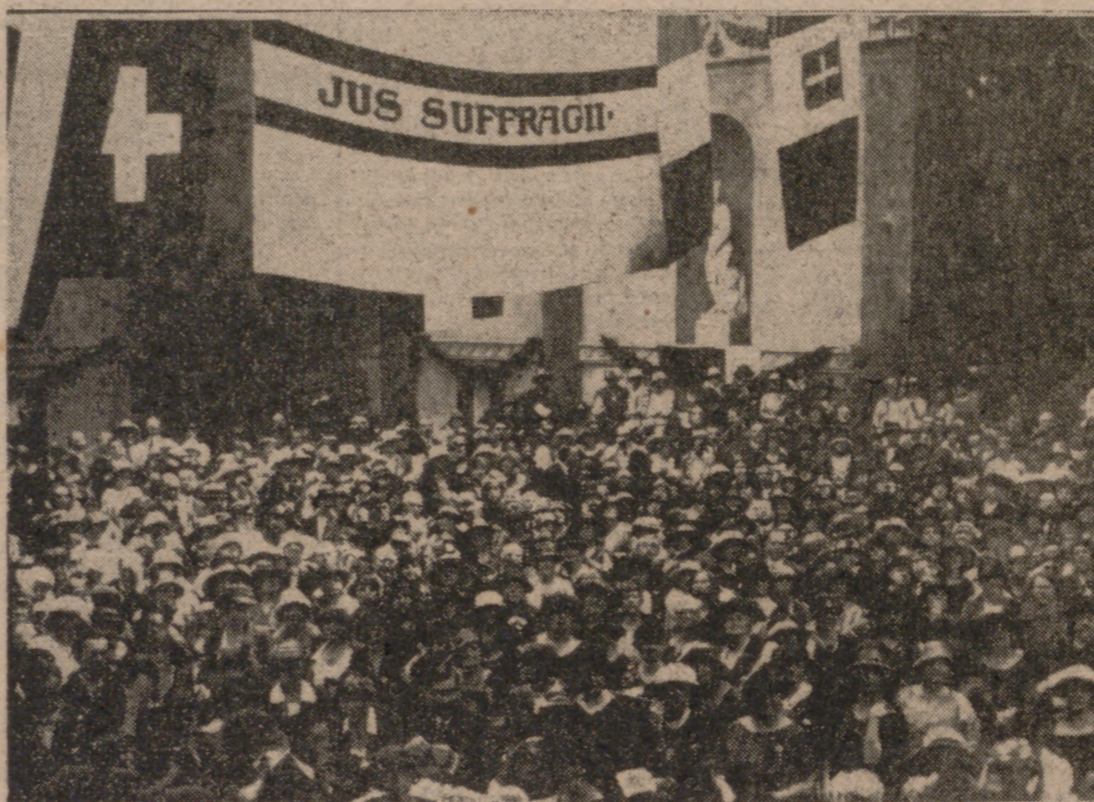
Los desfiles y manifestaciones feministas en defensa del voto para la mujer se multiplicaron en todas las esquinas de Europa y América del Norte, a partir de la segunda mitad del siglo XIX.

El trabajo femenino, a partir de la segunda mitad del siglo (Pasa a la página quinta)