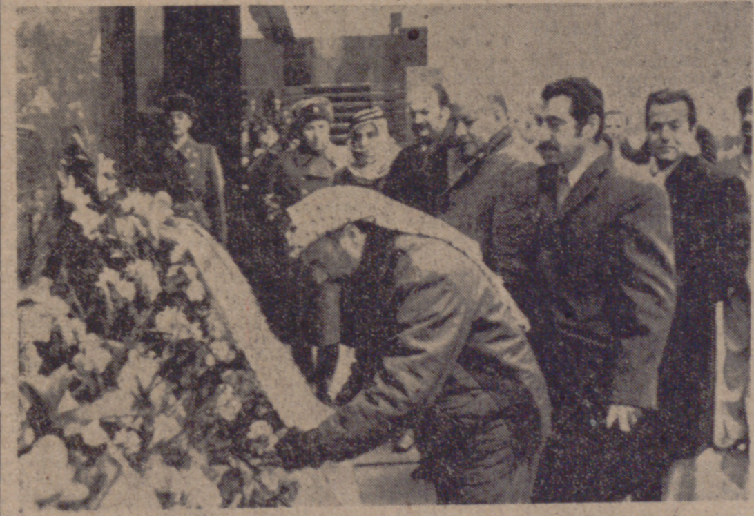
MOSCU.—El líder de la Organización para la Liberación de Palestina, Yasser Arafat, que se encuentra en la capital soviética, deposita una corona de flores ante la tumba de Lenin.