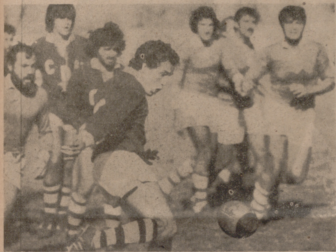
El impecable estilo del internacional Gijón queda perfectamente recogido en esta bella imagen. El fue el autor de dos transformaciones importantes en una mañana de pocos aciertos de los universitarios.

(14-10) Hasta el último segundo no pudo doblegar al Raca, de Sevilla