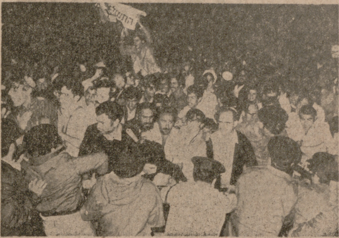
JERUSALEN.—La foto recoge a un grupo de manifestantes, entre 8.000, que protestaron contra la presencia del secretario norteamericano de Estado, Henry A. Kissinger. La Policía trata de impedir que los manifestantes se aproximen a las oficinas del jefe del Gobierno, Isaac Rabin.

Los palestinos y el petróleo, temas de sus entrevistas