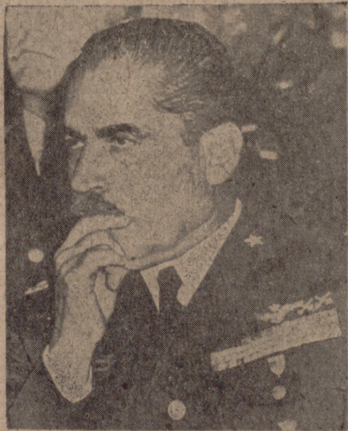
ROMA.—Reciente fotografía del general Duilio Fanali, ex jefe del Estado Mayor del Aire de Italia, el cual se halla bajo investigación judicial en conexión con una conjura para un golpe que hizo fracasar la lluvia. Los jueces, y según el testimonio de uno de los conjurados que vive en Suiza, han ordenado veinticinco arrestos contra ex asociados de Valerio Borghese, que se hacía llamar el "Príncipe Negro".