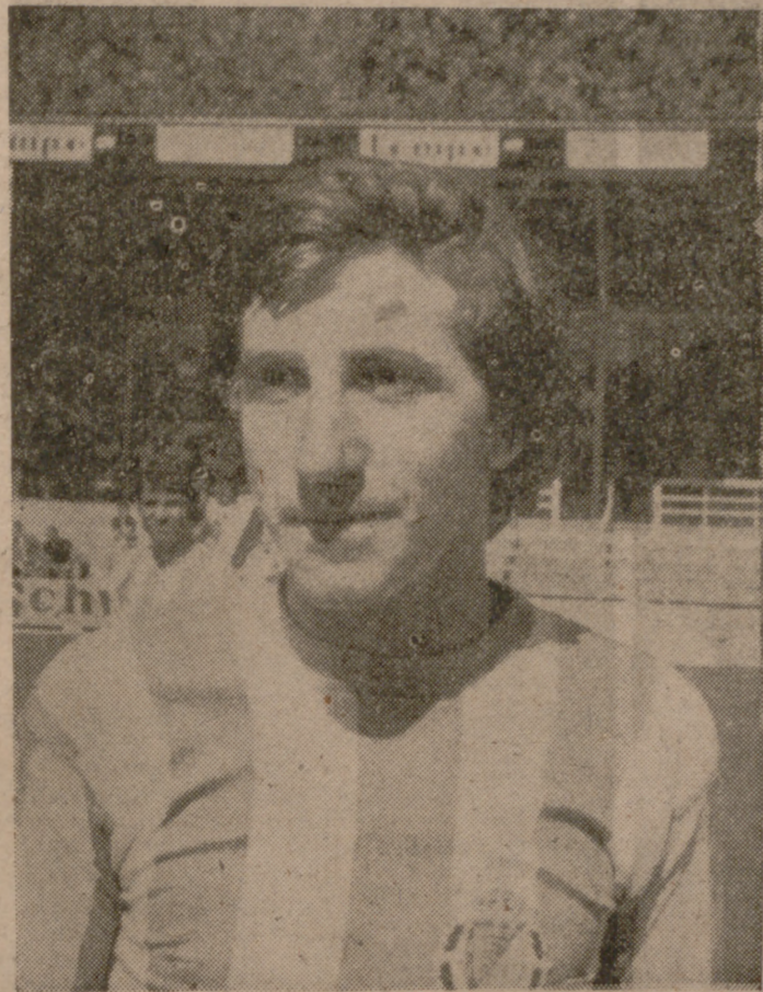
Gelo, que se ha reincorporado a la disciplina blanquívioleta, fue una de las novedades del entrenamiento de ayer.

obstante a y tenor de lo visto en el ensayo, todo hace suponer que será el joven extremo de Villanubla el hombre que ocupe desde el principio esa vacante dejada por el capitán, que acudió a presenciar la sesión de trabajo de sus compañeros.