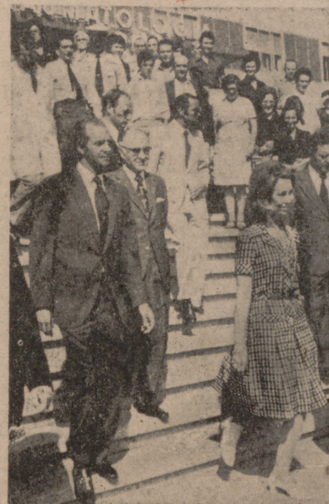
MADRID. — Los Príncipes de España visitaron ayer a los heridos del criminal atentado terrorista del pasado viernes en la calle del Correo. Don Juan Carlos y doña Sofía conversaron con todos ellos, interesándose por su estado de salud y sus circunstancias personales. En la foto, los Príncipes, al salir de la Residencia Sanitaria de "La Paz".