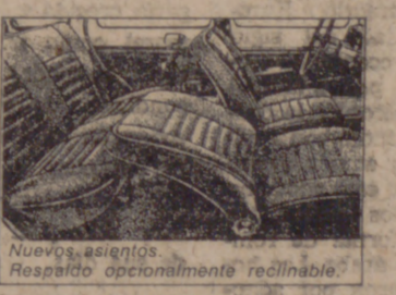
Nuevos asientos. Respaldo opcionalmente reclinable.

cambiables. Potencia DIN 44 CV a 5.900 r.p.m. Par máximo DIN 6,7 kg. m. a 3.500 r.p.m.