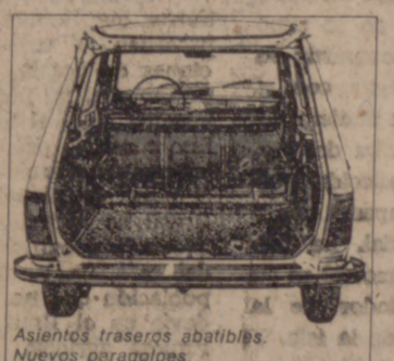
Asientos traseros abatibles. Nuevos paragolpes.