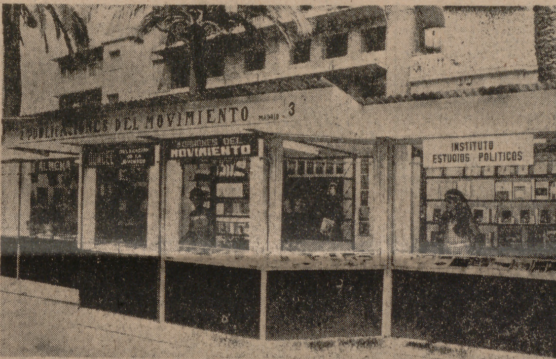
Ha sido inaugurada la Primera Feria Nacional del Libro, en Huelva. En la foto, la caseta números 2 y 3, de Publicaciones del Movimiento donde se exhiben los fondos editoriales de Ediciones del Movimiento, Instituto de Estudios Políticos, Editorial Almena, de la Sección Femenina, y Editorial Doncel, de la Delegación Nacional de la Juventud.