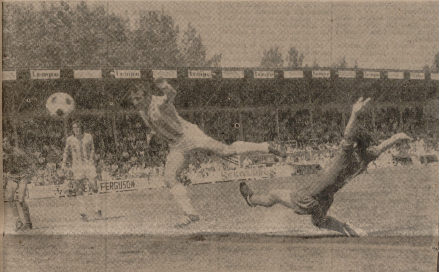
AL PALO.—Pudo y debió ser gol, porque el pase de Calandria era medio gol y Lizarralde no suele fallar en estos casos. Esta vez, sin embargo, el testarazo del capitán fue a estrellarse en la cepa del poste.

en un soberbio testarazo a saque de esquina botado por Díez, y poco después estaba a punto de repetirse la suerte, aunque Bernardo le graba impedirlo en última instancia.