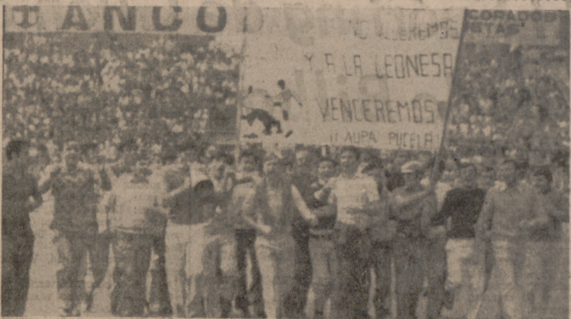
PANCARTAS.—No hubo protestas ni caras largas en el recibimiento al Valladolid, sino gritos de ánimo e incluso pancartas como éstas, que pasaron un grupo de aficionados, en el prólogo del encuentro, con redacción no muy cortés para el visitante. En esto se pasaron un poquito los hinchas...