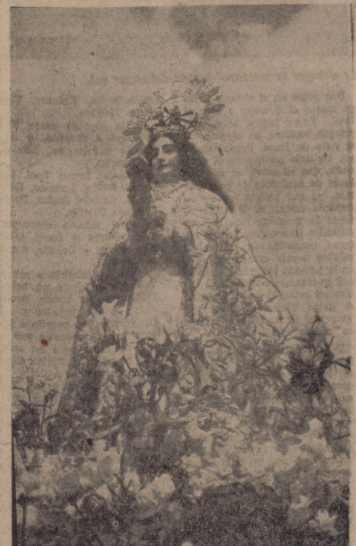
El día 8 de septiembre, Nava del Rey celebra su "día grande", dedicado a honrar a la Virgen, Patrona de la Villa, que cuenta con el amor y la devoción de todos los navarreses.

—Hace unos días, a través de una carta recibida del Ayuntamiento.