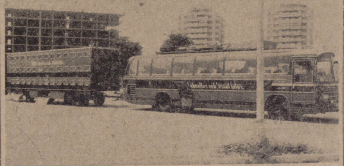
Ayer vimos por Valladolid, en olor de ferias y fiestas, este original y sorprendente autocar con un remolque especial para dormir. Este turismo económico resuelve numerosos problemas, pero principalmente asegura el descanso del viajero que, con frecuencia, va de la Ceca a la Meca implorando una cama para pernoctar y no siempre la encuentra. La escena del hotel a cuestas que ven ustedes fue tomada a los alrededores de la Feria de Muestras. Los actores se encontraban en la cafetería.