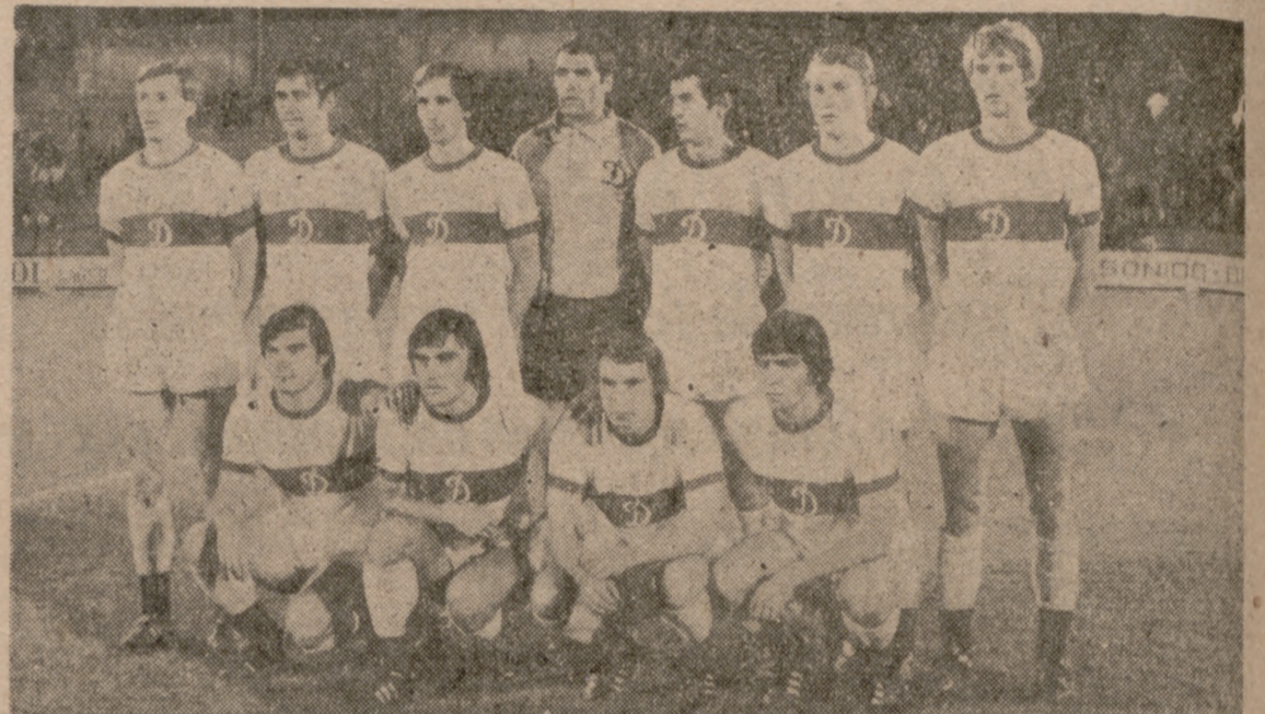
El Dynamo de Kiev confirmó su condición de gran favorito.

EL CAMPEON RUSO SE EXHIBIO TRANQUILAMENTE ANTE UN GRANADA QUE DEFRAUDO EN TODOS LOS ORDENES