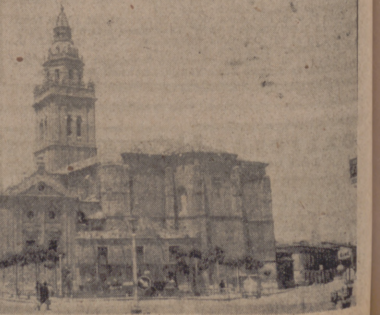
EL TEMPLO PARROQUIAL DE NAVA