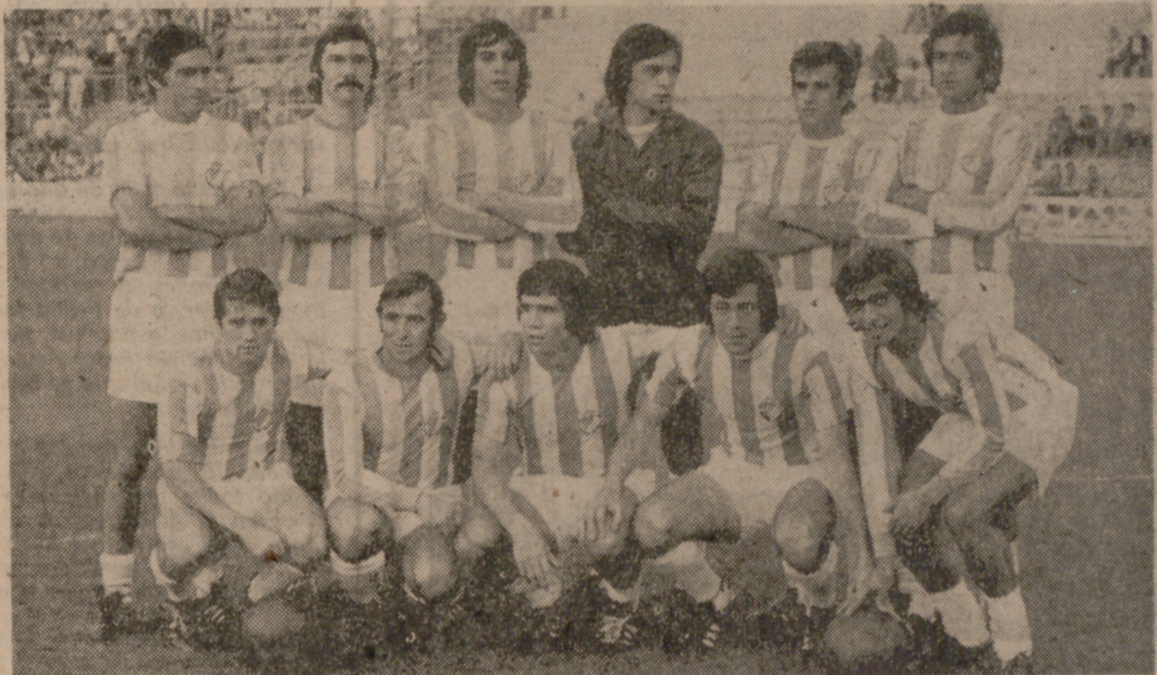
PRIMER EQUIPO. — Con esta alineación se presentó el Real Valladolid ante los aficionados; faltó conjunción, pero individualmente hubo cosas interesantes...