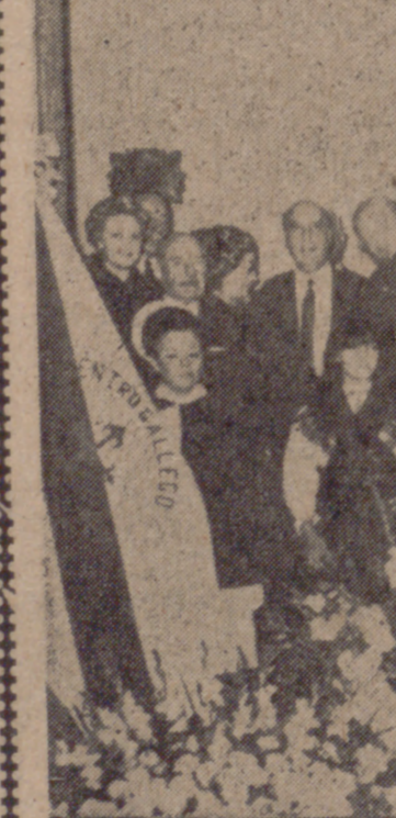
Homenaje a Rosalía de Castro ante su monumento, levitando en el vestíbulo del Centro Gallego.

Es evidente que aquí residimos más gallegos que en cualquiera de las capitales de nuestras provincias.