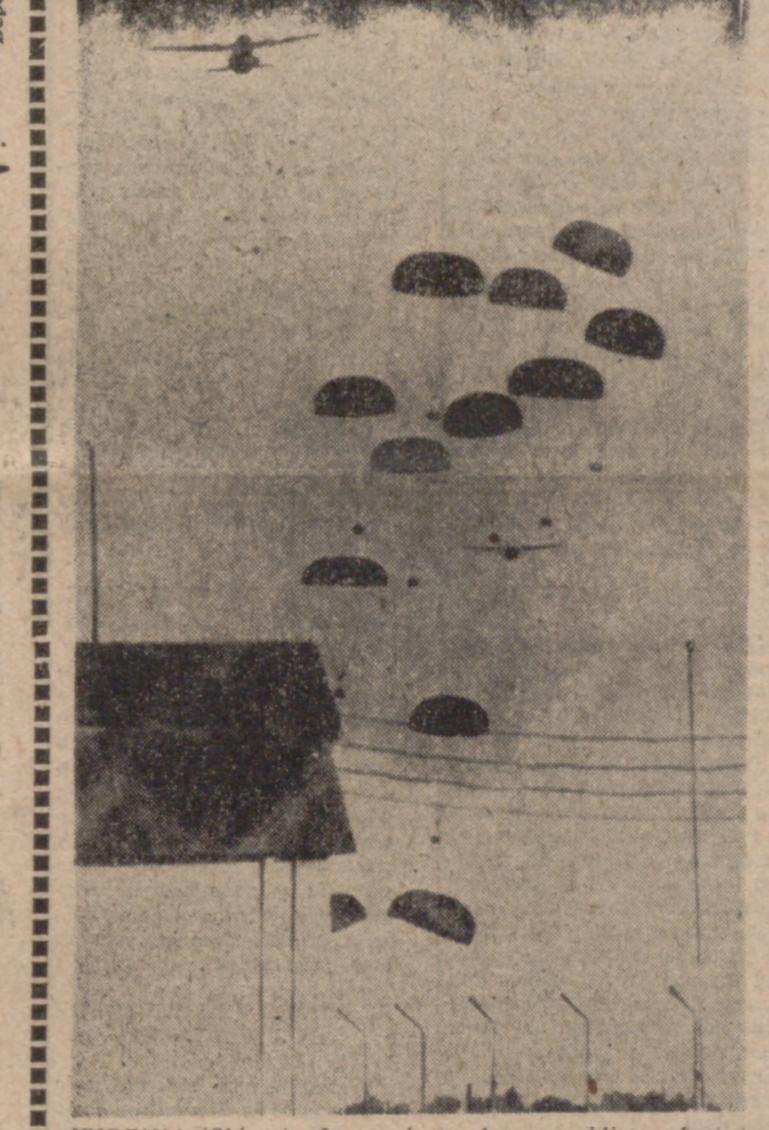
KYRENIA (Chipre).—Lanzamiento de paracaidistas durante la invasión turca de Chipre.

EN CHIPRE Parece que el alto el fuego es efectivo Mañana, conversaciones de paz en Ginebra