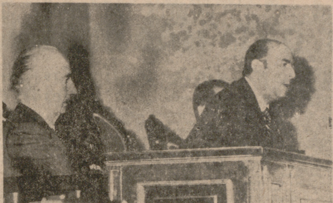
MADRID.—El Ministro Secretario General del Movimiento, señor Utrera Molina, durante su discurso en la sesión plenaria del Consejo Nacional del Movimiento.