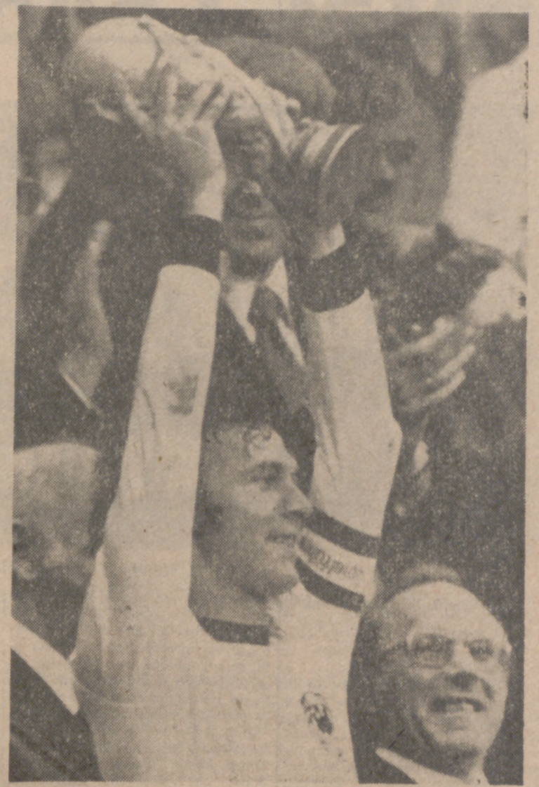
Franz Beckenbauer, capitán de la selección alemana, alza el trofeo de la FIFA, tan brillantemente conquistado.