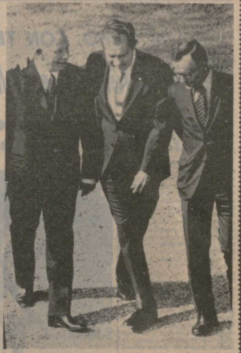
Dos poderes decisivos, USA y la URSS, representados en Nixon y Podgorny. El Presidente norteamericano charló amistosamente hace muy pocos días con su colega soviético. La mano por el hombro puede resumir la siempre discutible amistad.