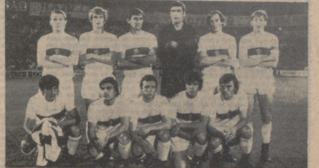
El Dynamo de Kiev, que causó sensación el año pasado y será éste uno de los grandes favoritos del Trofeo «Ciudad de Valladolid».