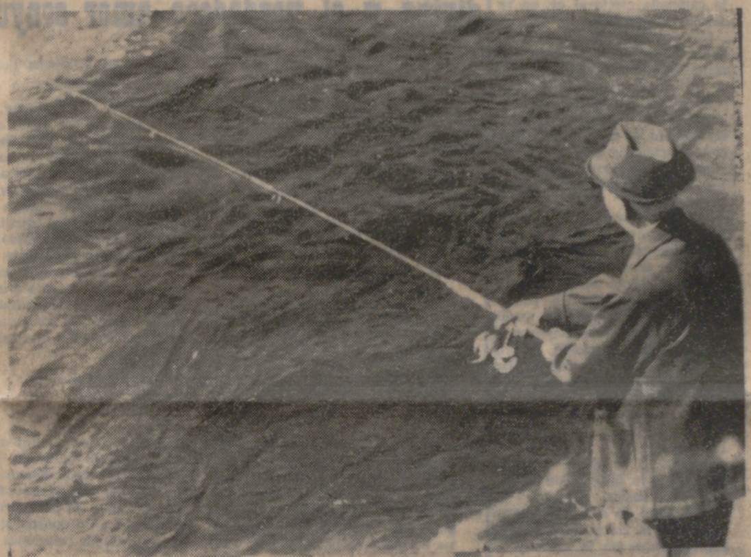
SANTIAGO DE COMPOSTELA (La Coruña).—El Generalísimo Franco, en el río Ulla, donde practica la pesca deportiva.