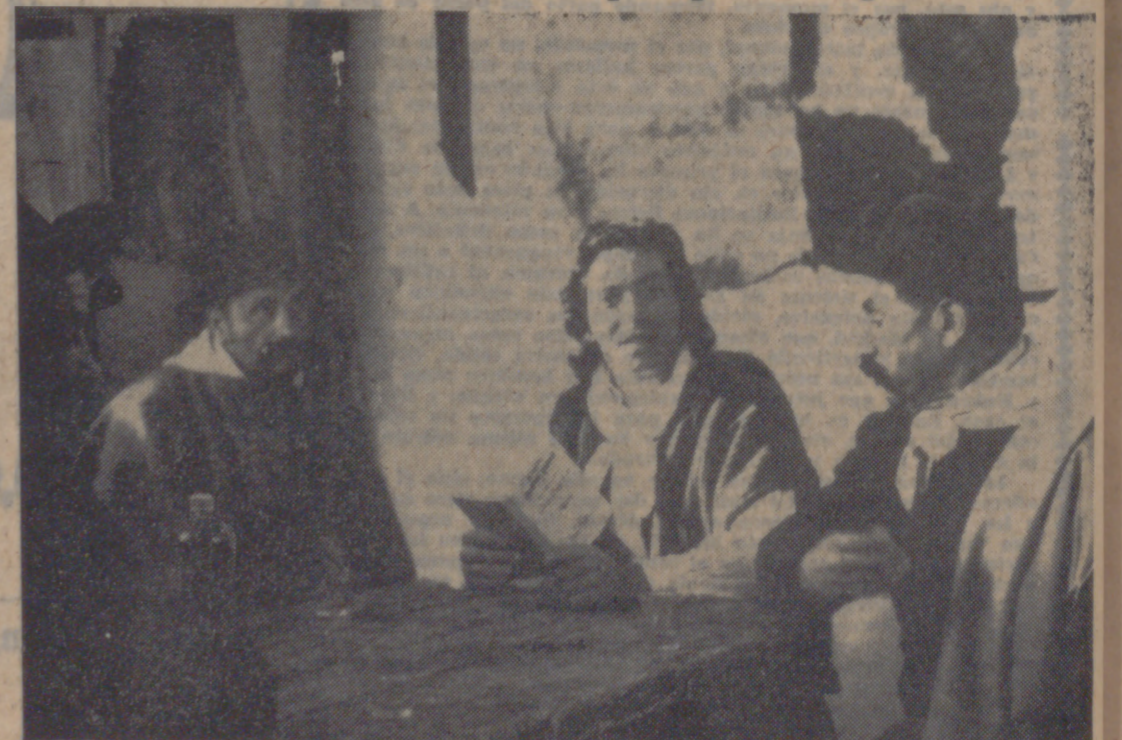
Una escena de «Martín Fierro», que próximamente emitirá TVE dentro de la serie «Los libros».