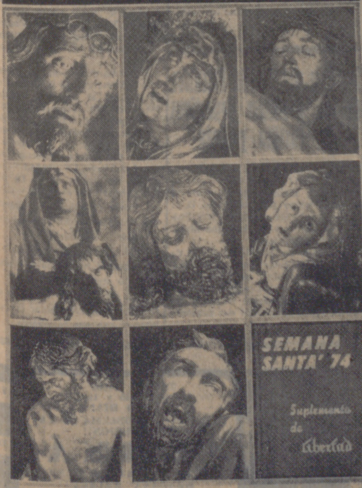
SEMANA SANTA '74