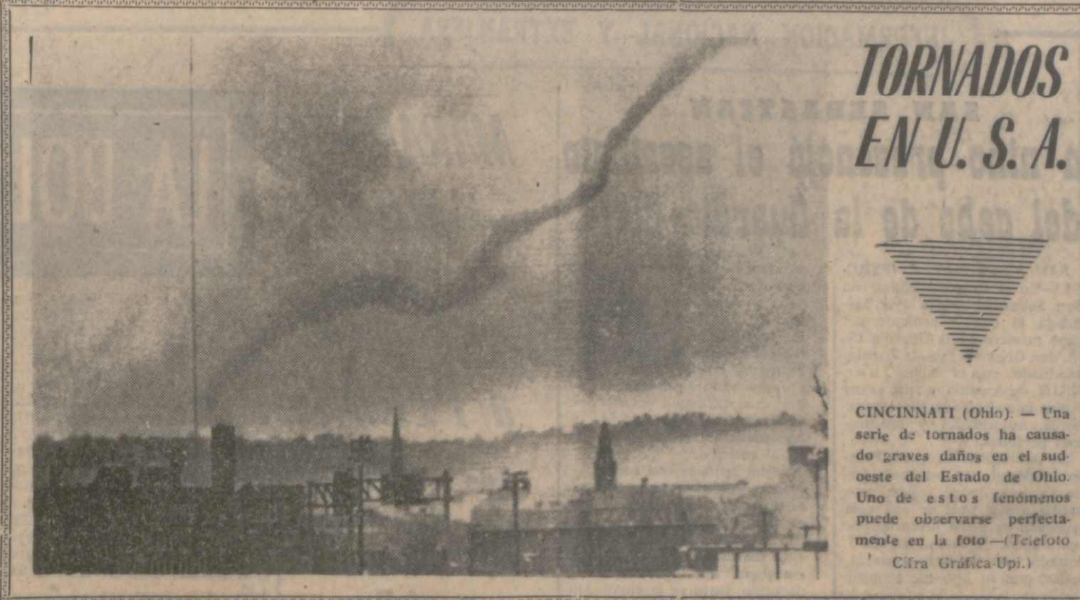
CINCINNATI (Ohio). — Una serie de tornados ha causado graves daños en el sudoeste del Estado de Ohio. Uno de estos fenómenos puede observarse perfectamente en la foto.