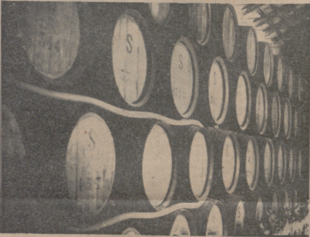
TODAS LAS REGIONES ESPAÑOLAS PRODUCEN BUENOS VINOS

Pero se producen unos vinos tintos, en cierto modo semejantes a los de la Rioja, a orillas del Ebro, robustos, con graduaciones de 14 a 15 grados, y existe hasta un Consejo Regulador de la denominación "Navarra", creado en 1958. En la parte norte de la provincia se producen vinos verdes con 8 y 9 grados, del estilo del chacolí.