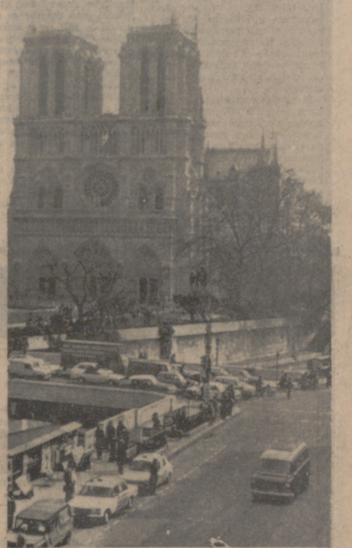
PARIS.—El coche fúnebre con los restos del fallecido Presidente Pompidou, a su paso por el Muelle de San Miguel, en la orilla izquierda del Sena, después del funeral celebrado en la iglesia de San Luis. Tras el coche fúnebre, el que conduce a la viuda del Presidente. — (Telefoto Cifra Gráfica Upi.)

Chaban-Delmas y Edgar Faure anuncian su candidatura a la Presidencia