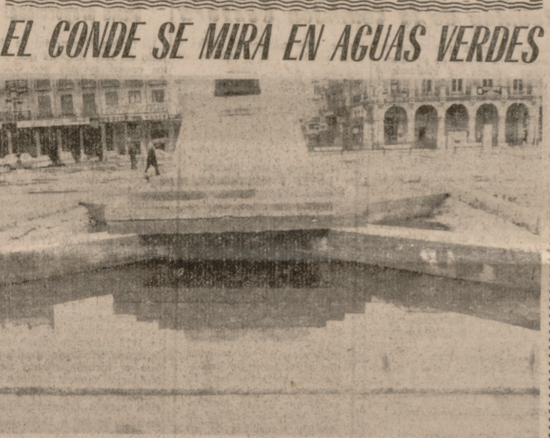
Dicen que cuando llegue la primavera la estatua del Conde Ansué estará rodeada por unos agradables jardinitos. Eso primará muy bien, porque algo que quitarle de austeridad a la piedra, alegrando, de paso, la vista a los vallisoletanos que pasean la Plaza Mayor. Pero en la actualidad el Conde es como una isla, con agua por todas partes, agua de lluvia estanca da, que el tiempo ha coloreado de verde y que empieza a producir un olor nada agradable. Sólo pedimos que el Conde se vea liberado cuanto antes de esta situación; de lo contrario, el olor se meterá cualquier día de lleno en el mismo Ayuntamiento, a un paso.