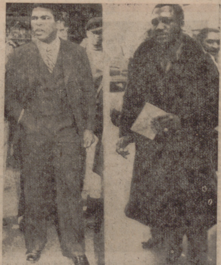
NUEVA YORK.—Más preocupada que por la preparación física, los dos ex campeones de boxeo, Cassius Clay (a la izquierda) y Joe Frazier, acuden al previo cassius para su próximo combate el día 28, luciendo uno un elegante traje de rayas y el segundo un abrigo de visón.