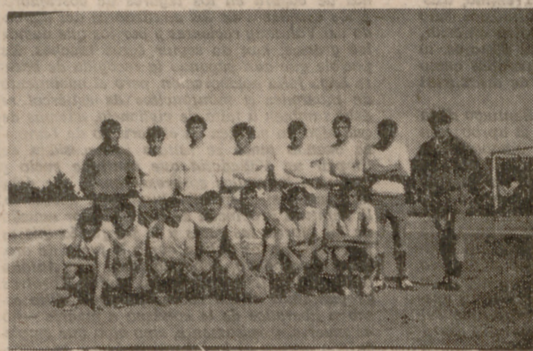
El Tudela, que el domingo perdió en Castródeza.

EN SEGUNDA CATEGORIA, COGECES Y RAYO MATAPOZUELOS MANDAN EN SUS GRUPOS