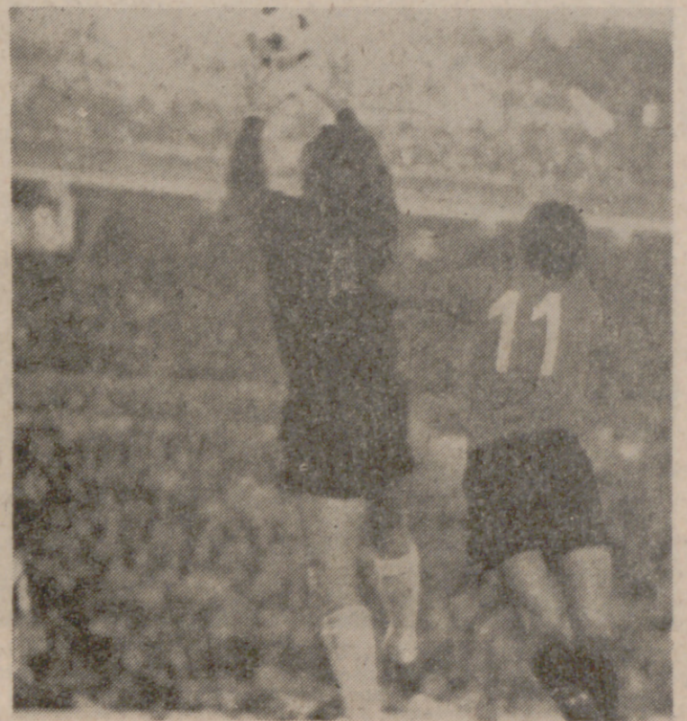
LIACER.—Buena actuación del meta blanquiverde en el "Luis Sitjar". En esta ocasión su salida evita el remate de Tmín.

El Valladolid pudo resolver el partido en la primera parte López Cuadrado anuló un gol de Lorenzo por supuesto fuera de juego