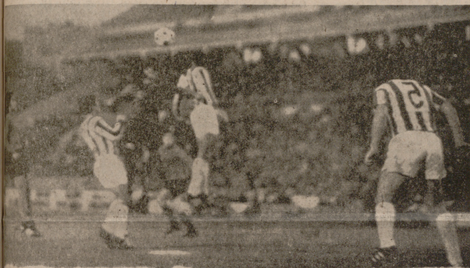
LEGUIZAMON.— El central paraguayo fue el hombre más efectivo del equipo vallisoletano, y en la instantánea le vemos anticipándose, una vez más, al ariete local, "Chango" Díaz.