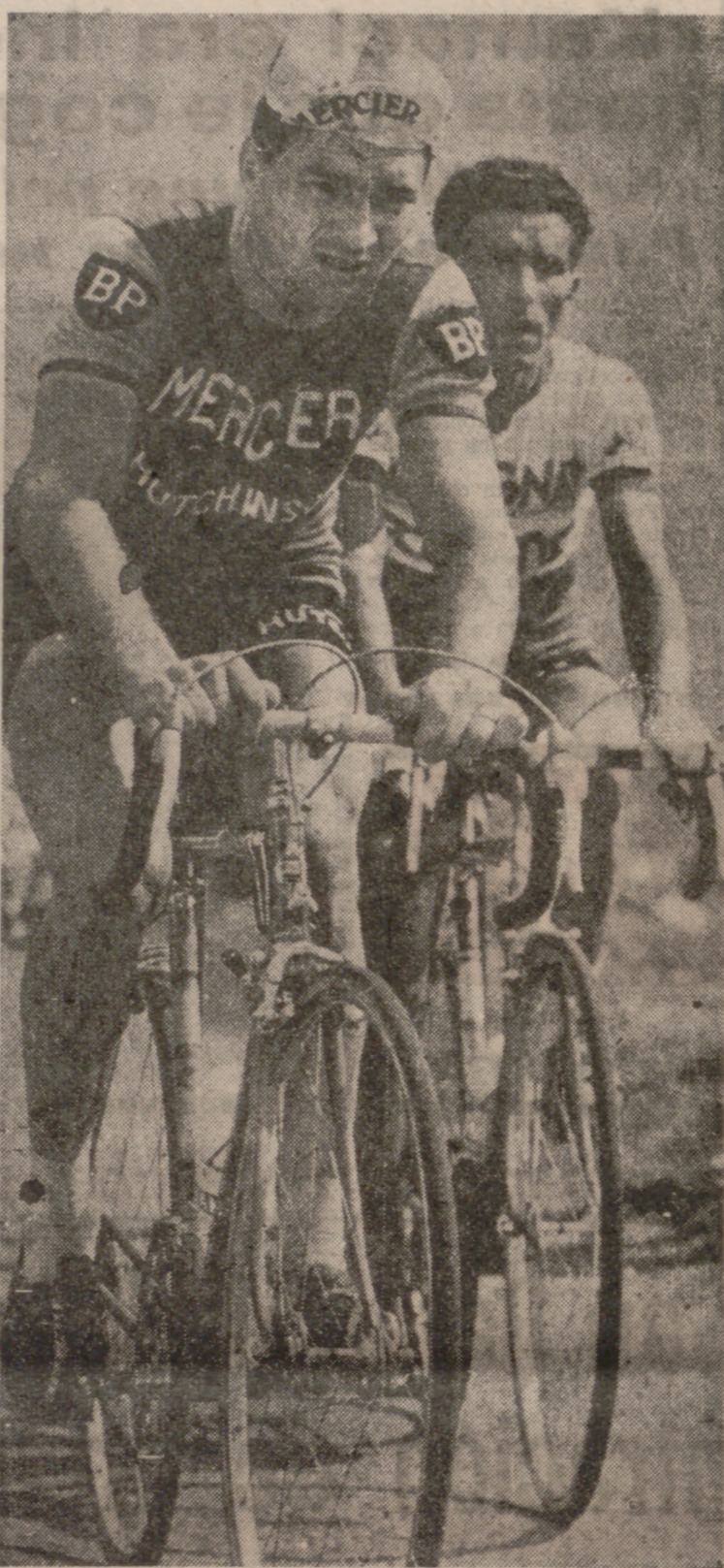
Raymond Poulidor, el gran veterano del ciclismo europeo, ha añadido un triunfo más a su historial. En la foto, de archivo, aparece en sus tiempos de competencia con Bahamontes.

La clasificación de la etapa de ayer fue esta: 1.—Van Springel (Bél.), 7-10-26. 2.—De Geest (Bél.), 7-10-27. 3.—Caverzasi (It.), id. 4.—Moser (Italia), id. 5.—Bergamo (Italia), id. 6.—Juliano (Italia), id. 7.—Vanucchi (Italia), id. 8.—Marchetti (Italia), id. 9.—Farisato (Italia), id. 10.—Peccolo (Italia), id.